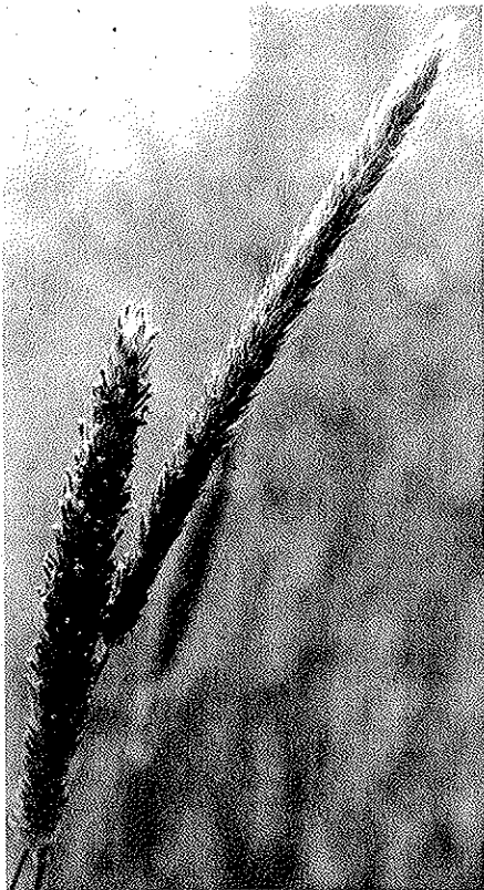
Abb. 1. Der Wiesenfuchsschwanz ( Alopecurus pratensis L.) muss frühzeitig genutzt werden, dann liefert er ein qualitativ gutes Futter.

Stadium im Mittel der sieben Beobachtungsjahre bereits am 24. April, während die später blühenden Arten (zum Beispiel Timothee und spätreifes Knaulgras) die Ähren oder Rispen erst Ende Mai schoben. In den Folgeaufwüchsen bildeten einige Arten nur noch Blätter (vegetatives Wachstum), andere auch generative Triebe (Tab. 1). Diese Triebe erreichten gegen Ende des Aufwuchses in den meisten Fällen das Stadium «Beginn Ähren-/Rispen-schieben» bis «volles Ähren-/Rispen-schieben».