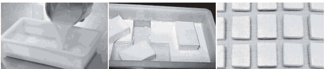
Abb. 3. Auch eine Portionierung ist möglich.

Abb. 2. Das Milchkonzentrat kann in eine beliebige Form abgefüllt werden.