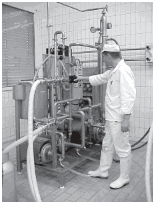
Abb. 1. Die Milch wurde mit dieser Mikrofiltrationsanlage aufkonzentriert.

An der FAM wurde ein neues, ausgesprochen einfaches Verfahren für die Herstellung von Käse entwickelt: Rohe, standardisierte Milch (0.5 – 4.0 % Fett) wird durch eine 100 nm Membran mikrofiltriert (Abb.1). Von zentraler Bedeutung sind dabei die Temperatur-, Druck- und Strömungsverhältnisse, wobei die Druckdifferenz über die gesamte Membran konstant gehalten wird (UTP: Uniforme Transmembrane Pressure). Bei der Mikrofiltration werden das Kasein und das Fett aufkonzentriert. Ein Konzentrationsfaktor von 5 – 8 (je nach angestrebter Trockenmasse im Käse) führt zu einem Konzentrat, das direkt für die Herstellung von Weich- oder Halbhartkäse verwendet werden kann. Nach der Zugabe von Kulturen (Starter- und Oberflächenkulturen), Labextrakt (ca. 0.2 ‰) und Salz (ca. 1 %) wird das Konzentrat in eine beliebige Form abgefüllt und während 5 - 20 Minuten bei 35 - 38 °C zur Gerinnung gebracht. Nach der Ger-