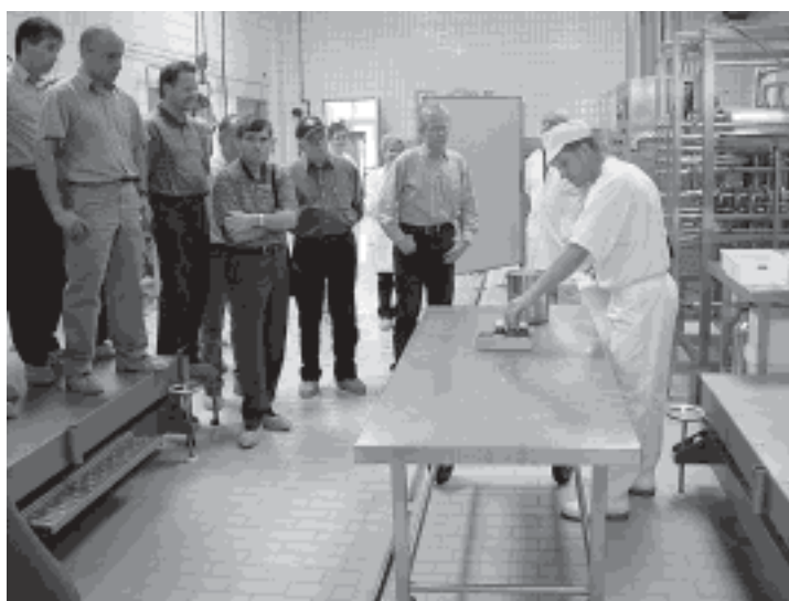
Abb. 4. Praktische Vorführung des neuen Verfahrens an der FAM.

Ein ganz neue Form der Anwendung könnte bei den Privathaushalten entwickelt werden. Das Konzentrat ist gekühlt gut haltbar und kann auch tiefgefroren werden. So wird es möglich, das Konzentrat direkt an Haushalte