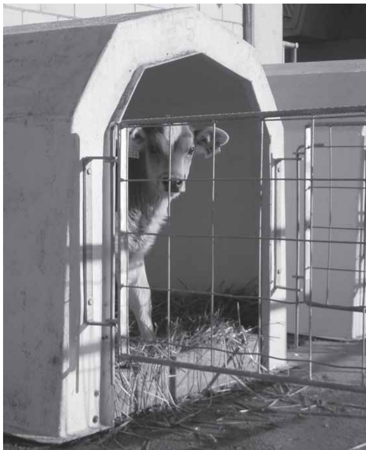
Abb. 1. Die positiven Auswirkungen der Iglu-Haltung auf die Gesundheit der Kälber sind mehrfach nachgewiesen worden.

In spezialisierten Kälbermastbetrieben sind die jungen Kälber, die von verschiedenen Betrieben stammen, bei der Einstellung im Maststall einem starken gesundheitlichen Druck ausgesetzt. Die Entwicklung und Ausbreitung von Infektionskrankheiten stellt ein hohes Risiko dar, so dass in den meisten Fällen während der ersten Woche nach dem Einstellen eine einwöchige medikamentöse Behandlung empfehlenswert ist. Im Verlaufe der Mastperiode ist später im Allgemeinen eine zweite Behandlung der ganzen Gruppe oder einzelner Tiere mit Antibiotika erforderlich. Diese therapeutischen Massnahmen sind nicht nur ein bedeutender Kostenfaktor für den Mäster, sondern schaden auch dem Image dieses Produktionsverfahrens. Der multifaktorielle Ursprung von Infektionskrankheiten beim jungen Kalb erfordert eine Optimierung aller prozessbeeinflussenden Faktoren. Zum Zeitpunkt des Verbots antimikrobieller Leistungsförderer (AML) wurde von der Arbeitsgruppe «Forschung und Beratung» ein Merkblatt erstellt mit den verschiedenen Massnahmen, die für eine Verbesserung der Kälbergesundheit getroffen werden müssen (Anonym 1999). Auch die Optimierung der Stallsysteme gehört zu diesen Massnahmen. Deshalb wird seit 1999 ein neues Haltungssystem, welches als RAUS-Verfahren bezeichnet wird (Tiere mit Regelmässigem Auslauf im Freien), gemäss Verordnung des Eidgenössischen Volkswirtschaftsdepartements vom Bund finanziell unterstützt. In diesem