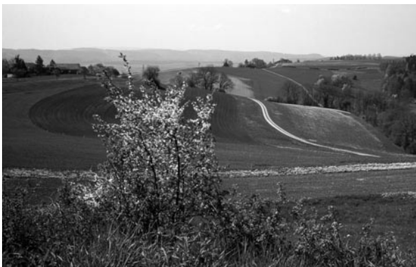
Abb. 1. Ökomassnahmen beziehungsweise ÖLN sollen die negativen Auswirkungen der Landwirtschaft auf die Umwelt verringern (Stoffaussträge), die natürlichen Ressourcen erhalten (Boden) und positive Wirkungen verstärken (Biodiversität).

Den Evaluationsprojekten erwachsen zwei grundlegende methodische Schwierigkeiten. Die erste war darin begründet, dass – als 1995 der Evaluationauftrag erteilt wurde – bereits ein beträchtlicher Anteil der LN nach den Regeln von IP und Bio bewirtschaftet wurde. Während in den Bereichen Stickstoff und Phosphor zumindest teilweise auf bereits bestehende Messnetze oder frühere Forschungsarbeiten zurückgegriffen werden konnte, fehlte im Bereich der Biodiversität eine Erhebung des