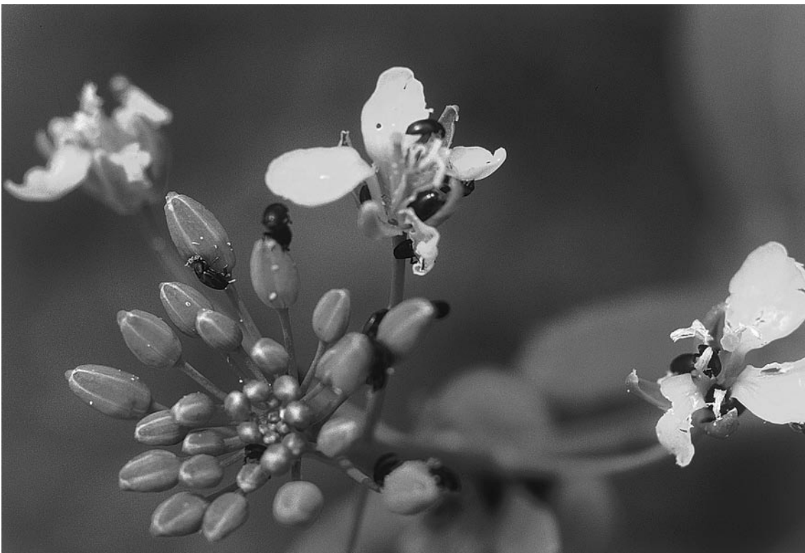
Abb. 1. Rapsglanzkäfer auf einem Rapsblütenstand.

Rübsen bewährt (Büchi 1990). Versuche, Räuber und Parasitoide des Rapsglanzkäfers mit der Anlage von ökologischen Ausgleichsflächen zu fördern, führten zu keiner Verminderung des Befallsdrucks (Büchi 2002). Eine weitere alternative Bekämpfungsmöglichkeit bietet die Anwendung von Krankheitserregern. deren Vorkommen und Bedeutung sind bis jetzt erst in Ansätzen untersucht worden. Hokkanen et al. (2003) erwähnen als natürlich vorkommende Krankheitserreger die Mikrosporidie Nosema meligethi , die zu den Urtierchen (Protozoen) gehört, und die beiden Pilzarten Metarhizium anisopliae und Paecilomyces fumosoroseus . In Mitteleuropa sind bisher keine detaillierten Untersuchungen über natürlich vorkommende Krankheitserreger durchgeführt worden. Kenntnisse darüber sind aber eine wichtige Voraussetzung