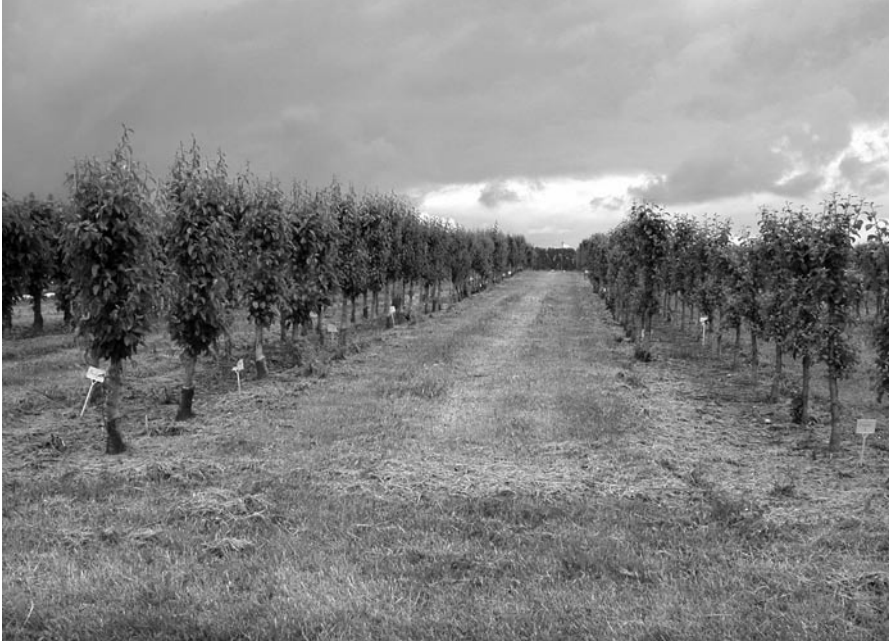
Abb. 4. Zertifizierter P2-Edelreiserschnittgarten.