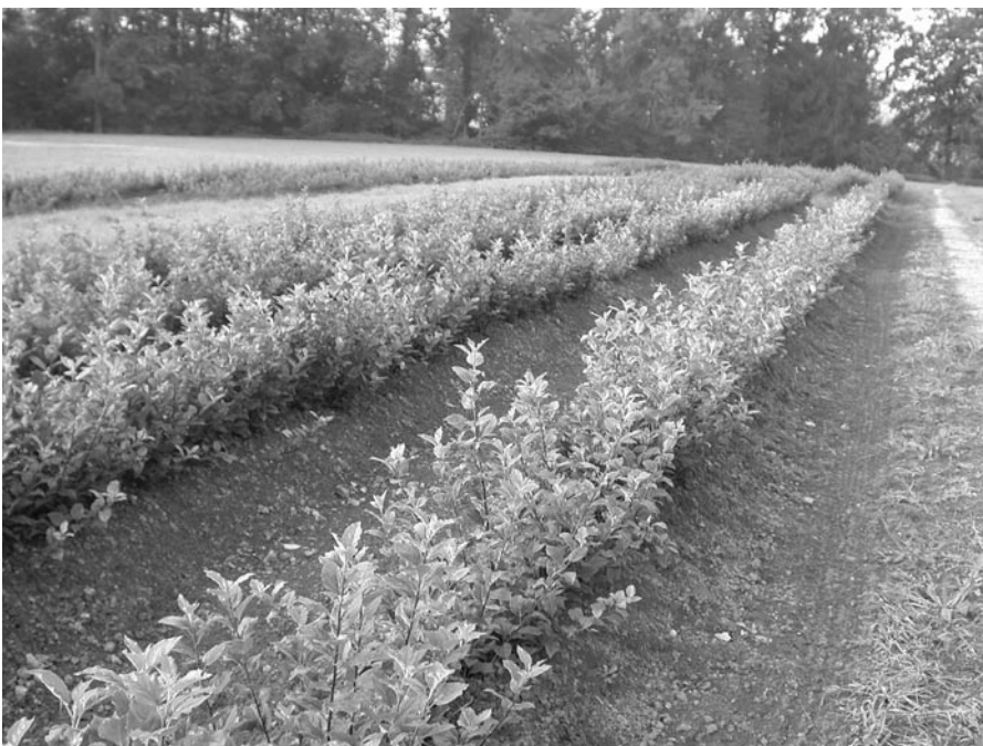
Abb. 5. Zertifiziertes P2-Unterlagen-Mutterbeet.

Kontrolleure von Concerplant. Im Weiteren sind die Baumschulen verpflichtet, über sämtliche Kulturmassnahmen Buch zu führen.