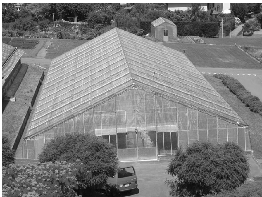
Abb. 1. Nuklearstock für Obstgehölze an der Forschungsanstalt Agroscope Changins-Wädenswil ACW in Wädenswil. Hier befinden sich zur Zeit zirka 430 virus- und phytoplasmenfreie Obstsorten.

Bis 2003 wurde aus dem P1- und P2-Edelreiserschnittgarten der Forschungsanstalt Agroscope Changins-Wädenswil ACW in Grabs zertifiziertes Pflanzenmaterial an die Deutschschweizer Baumschulen abgegeben. Seit 2004 existiert der Nuklearstock für Obstgehölz an der ACW in Wädenswil (Abb. 1; www.nuklearstock.info-acw.ch ). Die P1- und P2-Edelreiserschnittgärten sind bei verschiedenen Obstbaumschulen in der Schweiz untergebracht.