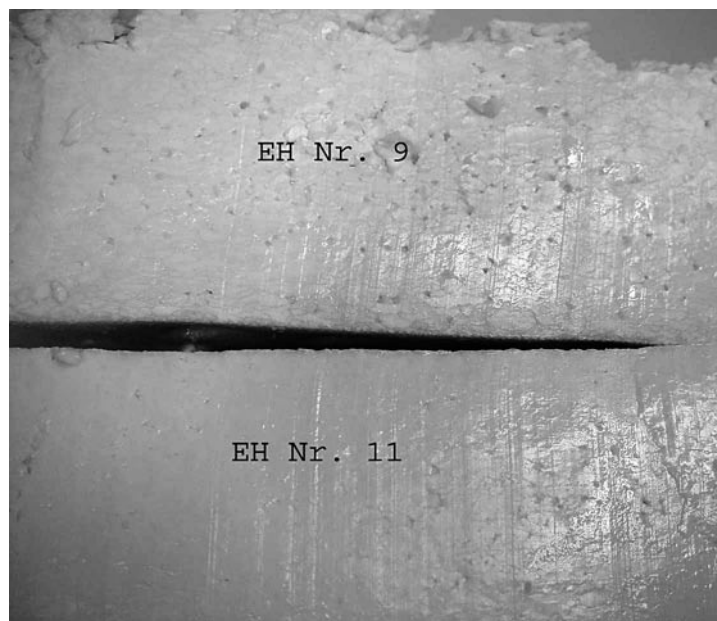
Abb. 2. Verwachsen der Bruchkörner im 24-stündigen Käse. Das Verwachsen war deutlich schlechter in den Varianten mit Zusatz von Zitronensäure (EH Nr. 9) als in den Varianten ohne Zusatz (EH Nr. 11).

Die Zitronensäure beeinflusste die sensorischen Eigenschaften der Käse in hohem Masse. Die Qualitätsbeurteilung war für alle Eigenschaften (Lochung, Teig, Aroma) schlechter, ebenso die