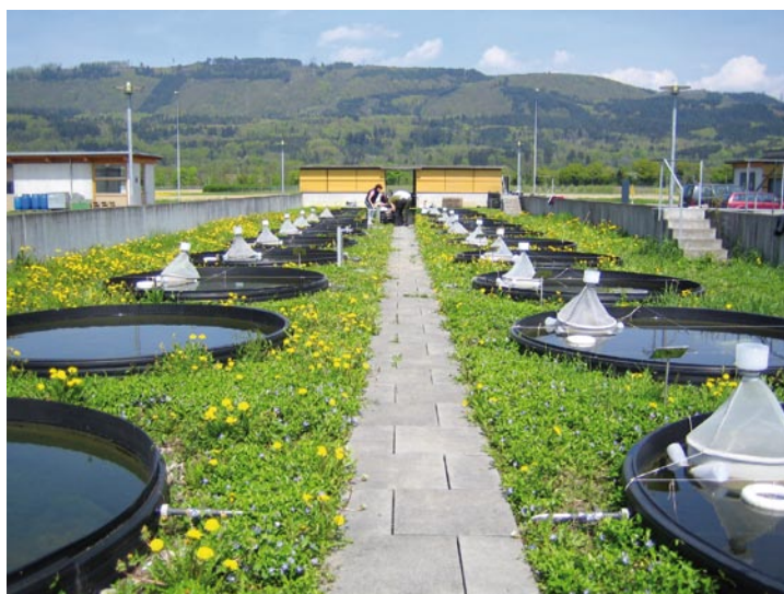
Abb. 2. Mesokosmenanlage, Syngenta Crop Protection AG, Stein, Schweiz (Foto: K. Knaur).