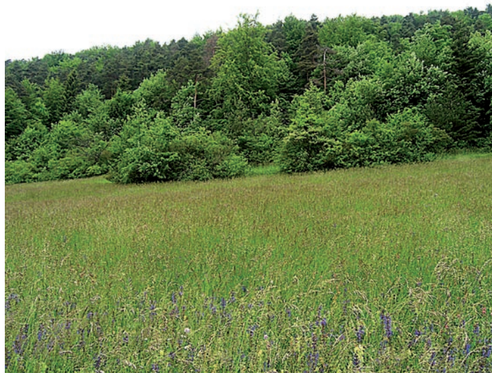
Abb. 7. Pflanzen, Tiere und letztendlich der Mensch sind auf vielfältige, intakte Lebensräume angewiesen.

Die Erwartungshaltung der verschiedenen politischen und fachlichen Kreise an das Projekt sind sehr unterschiedlich. Das BLW, das als federführendes Amt die Arbeiten leitet, hat deshalb neben dem frühzeitigen Einbezug der betroffenen Bundesämter einen wissenschaftlichen Beirat und eine Begleitgruppe eingesetzt.