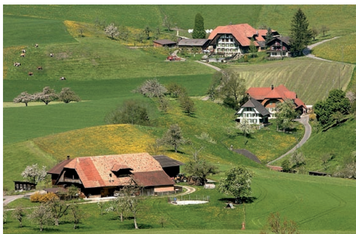
Abb. 4. Eine offene und vielfältige Landschaft prägt das Bild der Schweiz.

Wie diese Ziellücken geschlossen werden können, ohne dass die landwirtschaftliche Produktion eingeschränkt werden muss, wird ebenfalls Gegenstand des