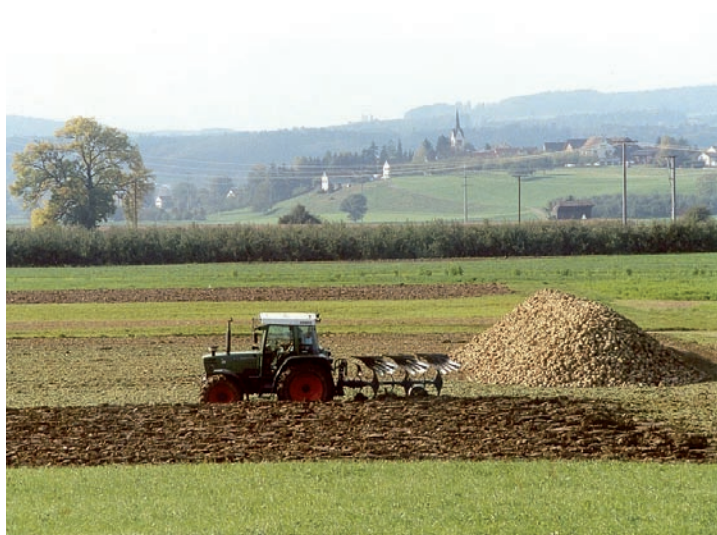
Abb. 6. Riechen Sie den Acker? Neben dem Beitrag an die sichere Versorgung der Bevölkerung haben Ackerbaugelände auch landschaftlich viel zu bieten.

Die Bundesverfassung hält fest, dass der Bund das bäuerliche Einkommen durch Direktzahlungen ergänzt zur Erzielung eines angemessenen Entgelts für die erbrachten Leistungen. Gemäss Landwirtschaftsgesetz sollen leistungsfähige und nachhaltig wirtschaftende Betriebe ein mit der Bevölkerung vergleichbares Einkommen erzielen. Dieses Ziel wird einerseits damit begründet, dass so die Leistungserbringung durch die Landwirtschaft langfristig sichergestellt werden kann (vgl. Botschaft zur AP 2002), andererseits ist es aber auch sozialpolitisch motiviert. In der Botschaft zur AP 2011 wird basierend auf dieser Zielsetzung dargelegt, dass die Geschwindigkeit der Reform der Agrarpolitik aus Gründen der Sozialverträglichkeit limitiert sei.