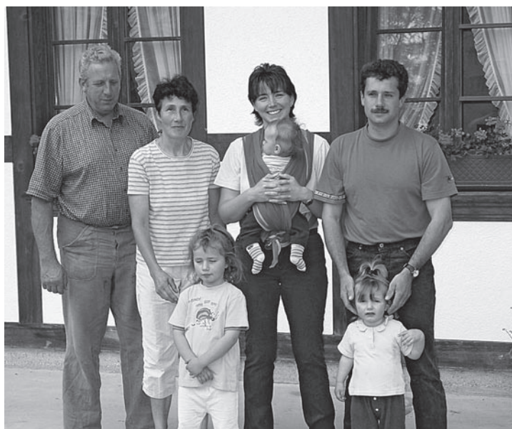
Abb. 3. Die Bauernfamilien erbringen mit ihrem Engagement gemeinwirtschaftliche Leistungen zugunsten der ganzen Gesellschaft – sie brauchen dafür ein angemessenes Entgelt.

Unter den natürlichen Lebensgrundlagen werden die Aspekte Boden, Wasser, Luft, Klima und Biodiversität verstanden. Intakte natürliche Lebensgrundlagen sind eine wichtige Voraussetzung für die landwirtschaftliche Produktion – heute, vor allem aber auch in Zukunft. Deren Qualität wird wiederum durch die Produktion beeinflusst. Während dieser Einfluss gegenüber einer Situation ohne Landwirtschaft bezüglich der Biodiversität und der