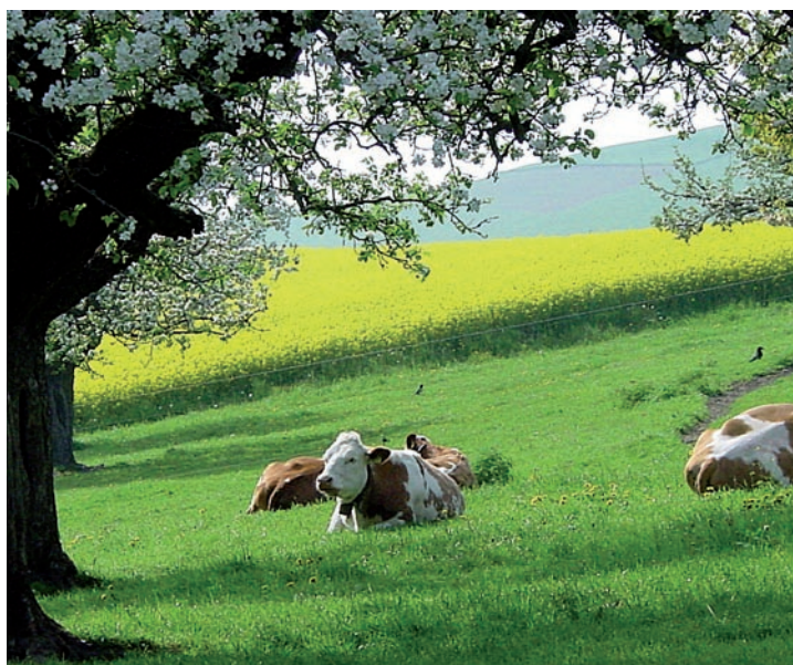
Abb. 5. Das Wohlergehen der Tiere ist der Schweizer Bevölkerung wichtig. Weidetiere sind zudem ein attraktiver Bestandteil der Landschaft.

Räume geben, die nicht respektive nicht mehr dauerhaft besiedelt sind.