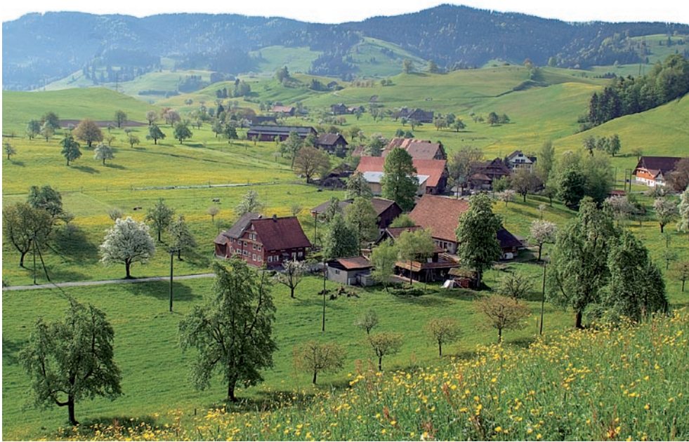
Abb.1. Bezüglich Globalproduktivität können die besten 17 % der Schweizer Talbetriebe mit Baden-Württemberg mithalten.

seits werden ihm keine öko- und ethologischen DZ zugerechnet, obwohl davon ausgegangen werden kann, dass verschiedene BW-Betriebe die Anforderungen für gewisse öko- und ethologische DZ erfüllen würden.