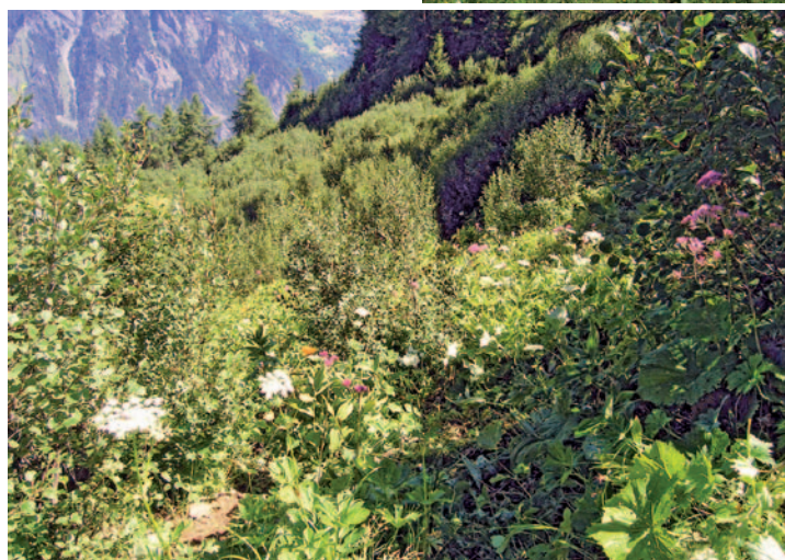
Abb. 4. Bewaldete Flächen (Erlenbestand).