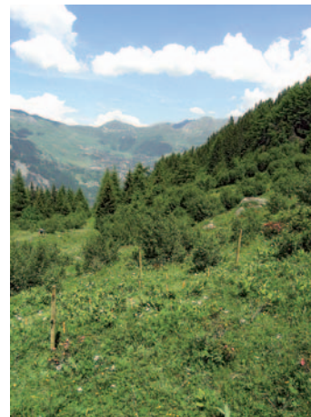
Abb. 3. Halboffene Flächen.

Bei jedem Umtrieb wurden Proben des Futters gewonnen, das die vier GPS-überwachten Kühe verzehrten. Die Tiere wurden abwechselnd während zwei 12-Stunden-Perioden (07.00-19.00 Uhr) verfolgt: erstmals zu Beginn der Rotation (1. oder 2. Tag), dann gegen deren Ende (4. oder 5. Tag). Die Proben (3 pro Tag und Kuh) wurden nach der