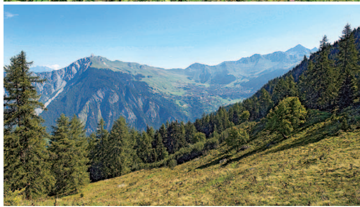
Abb. 2. Offene Flächen.