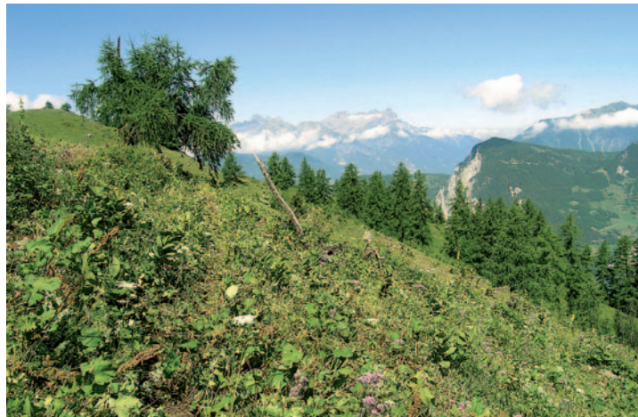
Abb. 1. Hochstaudenfluren.