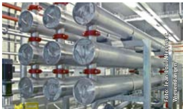
Abb. 3 | Umkehrosmose-Anlage.

meat. In einem letzten Schritt wurde das UF-Permeat mittels RO (Abb. 3) weiter aufbereitet. Durch Anlegen eines Drucks, der den osmotischen Druck übersteigt, wird die Flüssigkeit von einer Region höherer zu einer Region tieferer Konzentration (Gegenteil von Osmose) wieder durch eine semipermeable Membran gezwungen (Abb. 2). Die niedermolekularen Substanzen, die bei der UF die Membran noch passierten, werden nun als RO-Retentat zurückgehalten und aufkonzentriert. Wassermoleküle hingegen können die Membran passieren und gelangen in das RO-Permeat. Ausser den Feststoffen und dem RO-Permeat wurden alle aus der Gülleaufbereitung resultierenden Zwischen- und Endprodukte (Abb. 1) charakterisiert und deren NAE in Gefäss- und Feldversuchen ermittelt.