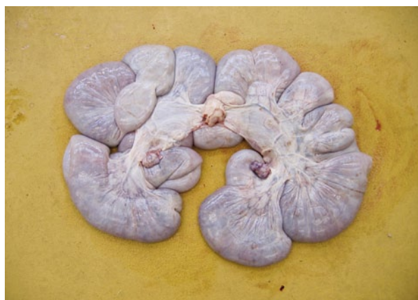
Abb. 1 | Nach der Schlachtung der Jungsaue wurden Gebärmutter und Ovarien auf krankhafte Veränderungen untersucht sowie die Anzahl und das Gewicht der Föten bestimmt.

Abstand von drei Wochen trächtig. An den Geschlechts- organen der 18 geschlachteten Jungsaue wurden keine krankhaften Veränderungen festgestellt (Abb.1). Die Mykotoxinbelastung beeinträchtigte weder die Anzahl noch das Gewicht der Foeten.