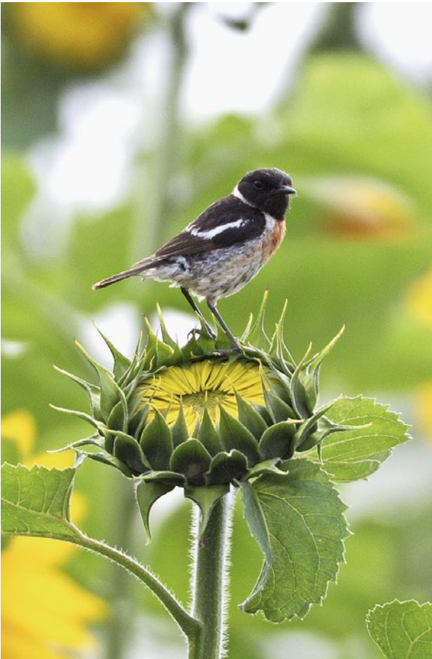
Abb. 4 | Das Schwarzkehlchen ist eine jener UZL-Leitarten mit positivem Bestandstrend.

was zu einer höheren Brutpopulation führt. Auch die Witterungsbedingungen in den Durchzugs- und Überwinterungsgebieten von Zugvögeln können Einfluss auf den Brutbestand haben. Diese kurzfristigen Bestandsveränderungen einzelner Arten überlagern die langfristigen Trends, die etwa durch veränderte Lebensraumbedingungen im Brutgebiet ausgelöst werden.