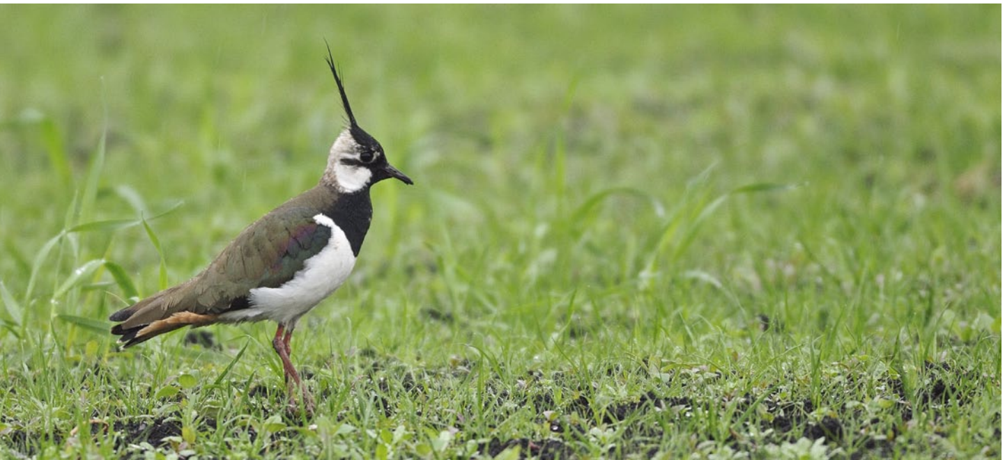
Abb. 1 | Der Kiebitz brüdet vor allem auf feuchten Ackerflächen. Wie viele andere UZL-Zielarten zeigt er einen rückläufigen Bestand. In den Neunzigerjahren brüteten in der Schweiz noch 400–500 Paare, heute sind es rund 100 Brutpaare.

Auskünfte: Niklaus Zbinden, E-Mail: niklaus.zbinden@vogelwarte.ch, Tel. +41 41 462 97 25