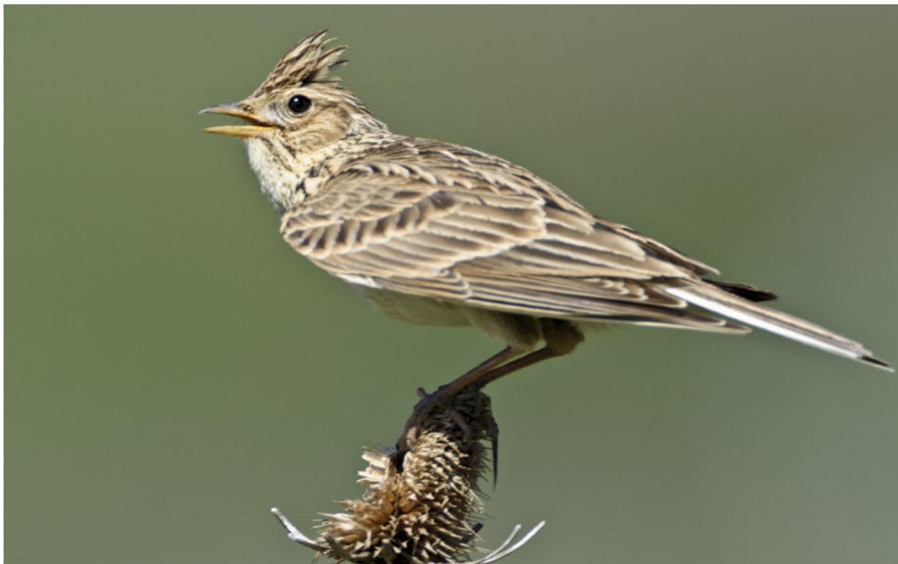
Abb. 5 | Der Bestand der UZL-Leitart Feldlerche nimmt im Kulturland ab.

turland abschätzen. Brutvögel, wie z.B. die Feldlerche (Abb. 5) machen unter allen UZL-Arten zwar nur einen kleinen Teil aus, im Gegensatz zu sehr vielen Arten anderer Gruppen sind sie aber nicht auf einen kleinen Standort (z.B. auf eine einzelne ökologische Ausgleichsfläche) beschränkt, sondern nutzen ganze Landschaftsausschnitte. Leider sind keine vergleichbaren Datensätze für die anderen Artengruppen bekannt.