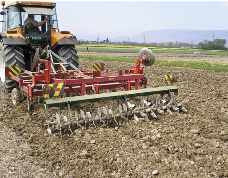
Oberflächliche Bodenbearbeitung mit dem Schälgrubber.