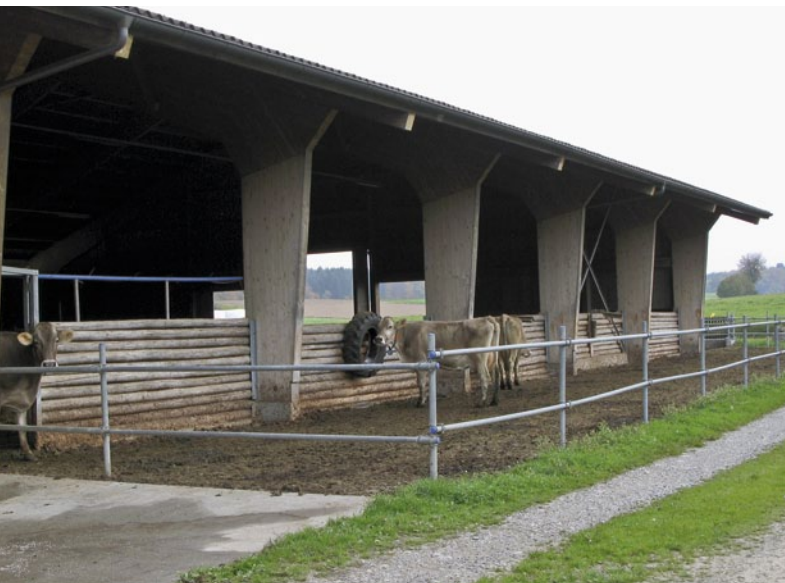
Die häufigste Situation der Laufstallhaltung von Milchvieh in der Schweiz: Liegeboxenlaufstall mit planbefestigten Laufflächen und Laufhof am Rand.

Auskünfte: Sabine Schrade, E-Mail: sabine.schrade@art.admin.ch, Tel. +41 52 368 33 33