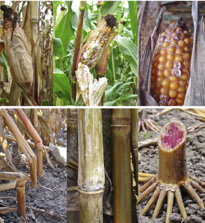
Abb. 1 | Kolben- und Stängelfäule auf Mais, verursacht durch Fusarium -Befall.

Auskünfte: Tomke Musa, E-Mail: tomke.musa@art.admin.ch, Tel. +41 44 377 72 39