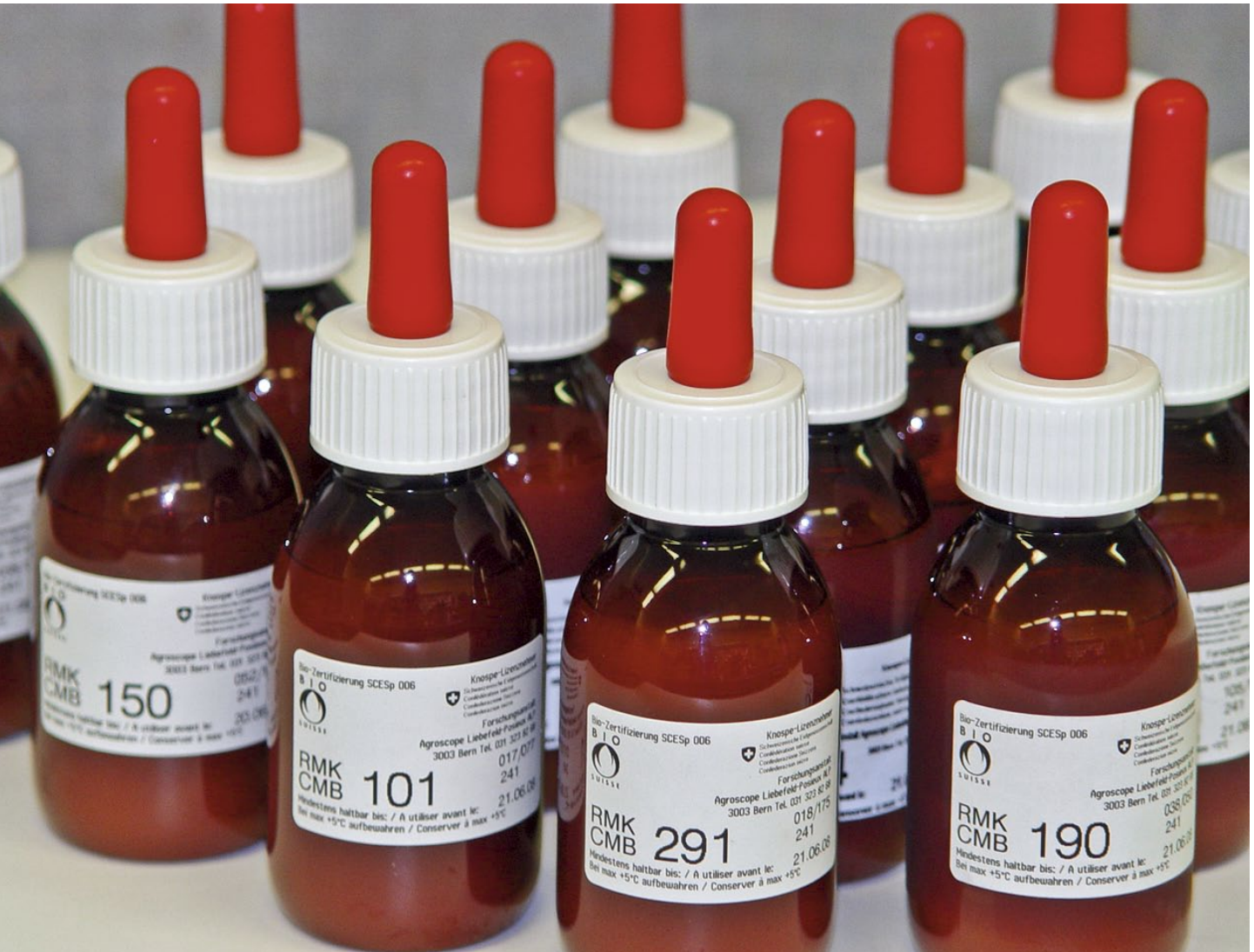
Heute werden die Kulturen wöchentlich in flüssiger Form versandt.