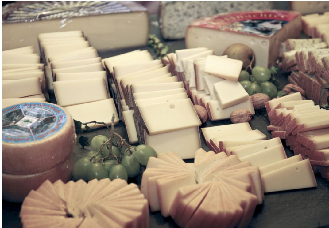
Abb. 4 | Käseplatte mit traditionellen Schweizer Käsen welche mit Kulturen von ALP hergestellt werden.

entwickelt (Koch 2006). Ausgewählte Kulturen sollen in Zukunft in lyophilisierter Form in den Verkauf gelangen. Dies erlaubt es, vermehrt Kulturen für Nischenprodukte (Alpkäse, lokale Spezialitäten, Hofverarbeitung) anzubieten und die heutige Kompetenz zu nutzen, auch Kulturen für weitere fermentierte Milch- und Fleischprodukte zu entwickeln und zu produzieren. Bereits im nächsten Jahr wird die erste Rohwurst-Kultur auf den Markt kommen.