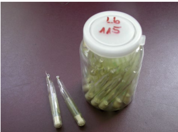
Abb. 2 | Lyophilisierte Konserve mit Milchsäurebakterien.

Weit fortgeschritten sind auch die Entwicklungsarbeiten für Kulturen, die eine gezielte Wirkung auf das Aroma oder die Produktsicherheit haben (Mallia 2008, Roth 2009). Noch etwas länger wird es dauern, bis Kulturen eingeführt werden können, welche die ernährungsphysiologischen Eigenschaften positiv zu beeinflussen vermögen, etwa durch probiotische Stämme (Ritter et al. 2009) oder durch die Bildung von bioaktiven Peptiden, die beispielsweise eine blutdrucksenkende Wirkung haben und so einen möglichen negativen Effekt des Kochsalzes ausgleichen.