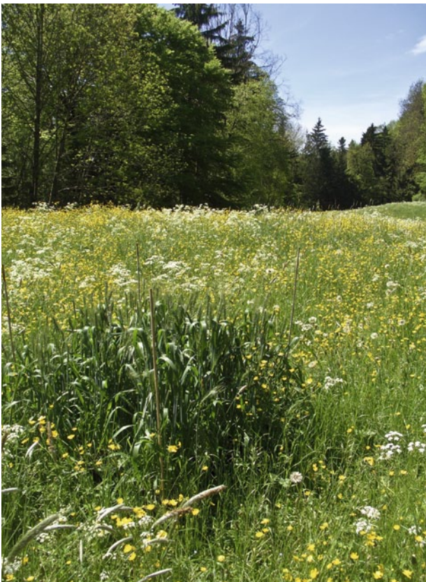
Abb. 2 | Untersuchungsfläche mit Weizentöpfen in einer Wiesenkerbel-dominierten Wiese in Niederhelfenschwil.

In den vier Orten Lenggenwil (SG), Niederhelfenschwil (SG), Wildensbuch (ZH) und Zollikofen (BE) wurden je eine von Wiesenkerbel-dominierte extensive Wiese (Abb. 2), eine extensiv bewirtschaftete Wiese, wo Wiesenkerbel höchstens spärlich vorhanden war, sowie ein Weizenfeld als Lebensraum ausgewählt. In jedem Lebensraum wurden drei quadratische 1-m 2 -Untersuchungsflächen in einem Abstand von 20 m auf einer Geraden ausgesteckt. Eine Untersuchungsfläche wurde mit neun Töpfen mit Sommerweizen bestückt, eine andere mit neun Töpfen mit von Blattläusen befallenem Sommerweizen, und in einer Untersuchungsfläche wurde die Vegetation als Kontrolle belassen, wie sie war. Die Reihenfolge der drei Untersuchungsflächen wurde jeweils zufällig angeordnet. >