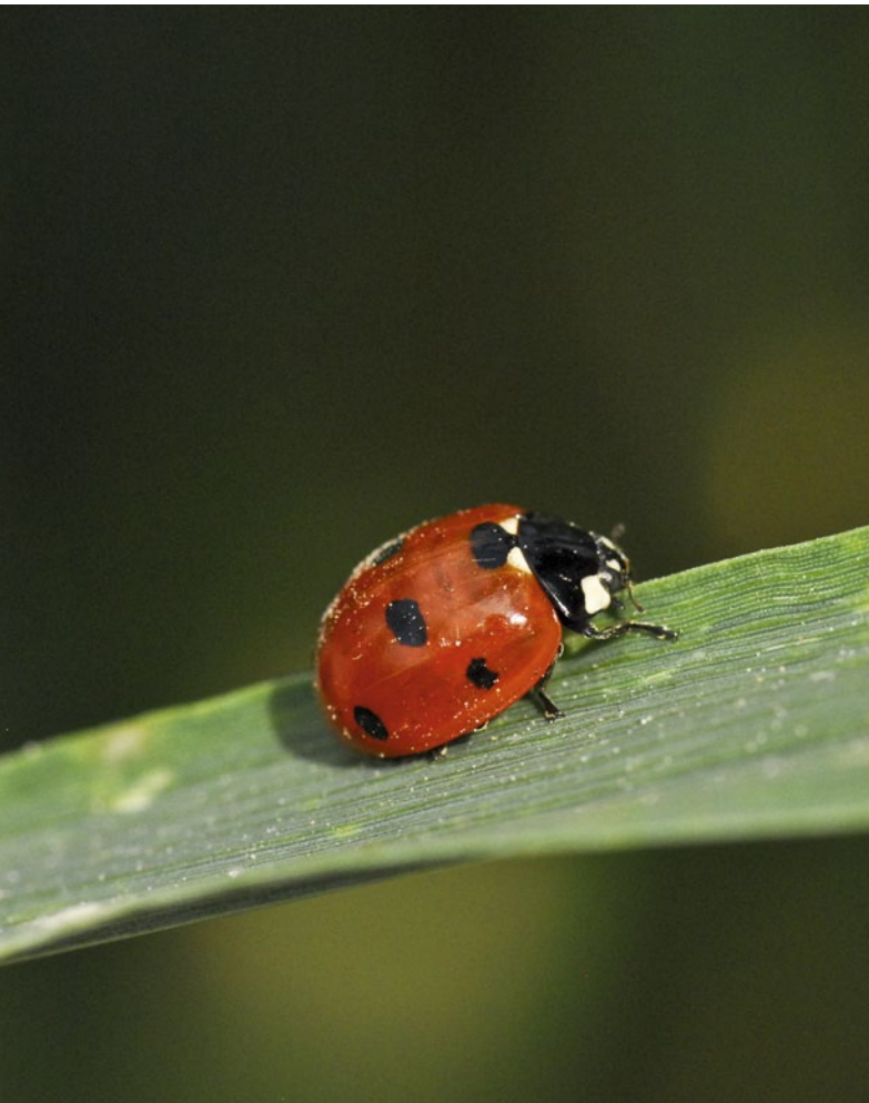
Abb. 1 | Die Mehrheit der mitteleuropäischen Marienkäfer-Arten ernährt sich von Blattläusen.