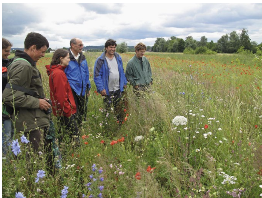
Abb. 3 | Diskussionen über Förderung der Artenvielfalt in Ackerbaugebieten z.B. mit Wildblumeneinsaat in Brachen und Säumen.

Studien bestätigt (z.B. Jurt 2003). Zudem konnten in den qualitativen Interviews Hinweise gefunden werden, wonach die Umsetzung von öAF vielfach durch praktische Gründe bestimmt wird. Beispielsweise werden extensive Wiesen bevorzugt auf ertragsärmeren oder schwerer zu bewirtschaftenden Standorten angelegt. Entgegen der Aussagen der Landwirte im qualitativen Befragungsteil korrelierten die sechs anderen Motivationen weder mit dem Anteil an öAF noch mit dem Anteil der gesamten öAF, die Qualität nach ÖQV aufweisen (Tab. 3). Neben den untersuchten Motivationen müssen also noch weitere Faktoren einen Einfluss auf das Verhalten (Ajzen 1991) bzw. die Umsetzung von öAF haben. ➤