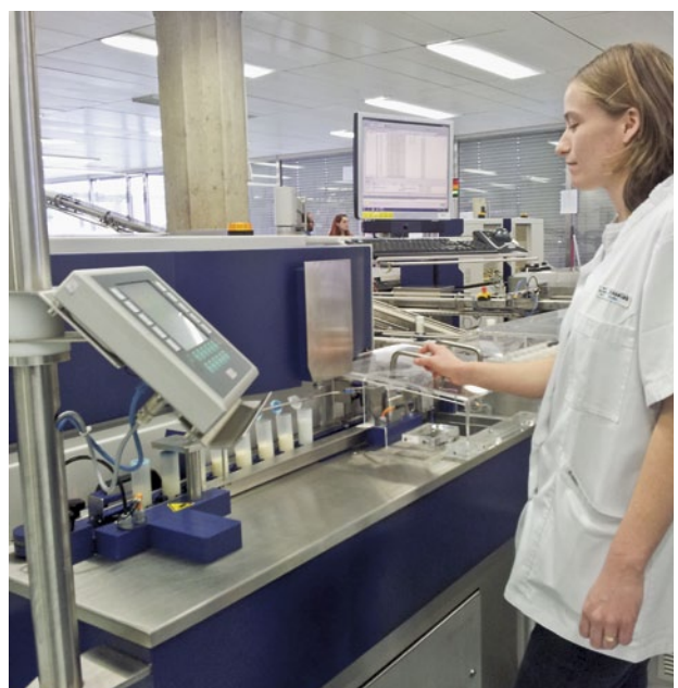
Abb. 4 | Bestimmung der Gesamtkeimzahl mit Foss BactoScan.

Die Erhebung wurde auf eine Zufallsstichprobe von n = \text{ca. } 500 ausgelegt, damit auch Proben mit «grenzwertnahen» und hohen Keimzahlen in der Stichprobe enthalten waren. Als Proben wurden solche mit vier Gemelken verwendet (zweitägige Milch, letztes Gemelk ab 6 Uhr). Aus Kapazitätsgründen wurde der Versuch auf sechs Tage im Zeitraum Juli und August 2011 verteilt. Die Proben wurden bei Emmi Ostermundigen und Suhr sowie Hochdorf Nutritec in Sulgen gesammelt. Der Probeauftrag ging direkt an die beteiligten Transportfirmen (TGL AG, Rolli Transporte AG, Meyer Transport AG und AS milch-logistik GmbH). Nach Probееingang im Labor wurden die Proben gesplittet. Beim Splitten erhielt jede Probe einen Barcode, damit die Rückverfolgbarkeit zur Ausgangsprobe, zur Untersuchungsserie und zum Milchproduzenten sichergestellt war. Bis zur Untersuchung wurden die Proben bei 1 bis 5 °C gelagert. Die Proben wurden um 12.00 Uhr (1. Probeteil) und 18.00 Uhr (2. Probeteil) des Folgetages untersucht (Abb. 4). Dies entspricht einem Probenalter von 30 und 36 Stunden ab letztem Gemelk. Die ältesten Gemelke hatten somit ein Alter von ca. 66 beziehungsweise 72 Stunden.