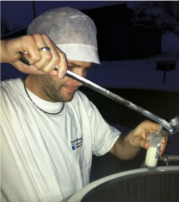
Abb. 2 | Manuelle Probenahme für die Milchprüfung.

Kampagne. Da aber in einem Sammelgebiet mehrere Käufer Milch übernehmen, sind die Abholtage unter den Käufern nicht abgestimmt. Das heisst, der eine Milchkäufer holt seine Sammelstellen an einem geraden, ein anderer an den ungeraden Tagen ab. Somit hat Suiselab keine Möglichkeit, den Probeerhebungsplan nach den Milchabfuhrdaten auszurichten. Um alle Sammelstellen auf den richtigen Tag anzubieten und darauf abgestimmt die Proben einzusammeln, müsste Suiselab viele Sammelgebiete zwei Mal anfahren, was mit erheblichen Mehrkosten verbunden wäre. Davon betroffen sind ca. 80 Sammelstellen und ca. 38 Sammeltouren. Berechnungen zeigen einen Zusatzaufwand pro Monat von 89 Stunden, 4697 km oder CHF 5281.–, beziehungsweise pro Probekampagne CHF 2600.–, pro Jahr (24 Kampagnen) CHF 62800.– und pro Probe CHF 4.– bei rund 650 Produzenten (Pittet 2011).