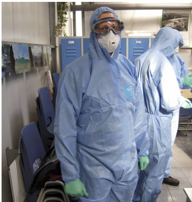
Abb. 4 | Mit Hilfe entsprechender Schutzausrüstung (Handschuhe, Schutzanzug, festes Schuhwerk und Atemschutz) ist es möglich, die Exposition gegenüber Pflanzenschutzmitteln zu reduzieren. Nur in den seltensten Fällen ist jedoch ein vollständiger Schutz bei der Ausbringung vom PSM notwendig. Die Beurteilungsstelle des SECO verfolgt beim Festlegen der persönlichen Schutzmassnahmen den Grundsatz «so wenig wie möglich und so viel wie nötig».