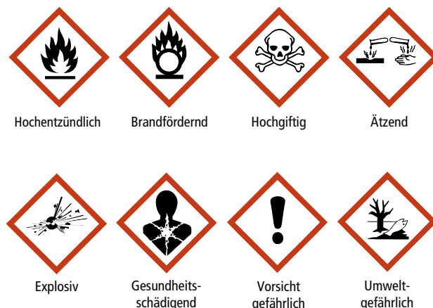
Abb. 2b | Einstufung und Kennzeichnung von Chemikalien nach dem neuen GHS System (Verwendung für Pflanzenschutzmittel ab Dezember 2012).

Gefahrensymbolen präzisieren die H-Sätze die Gefahren, die von den Produkten ausgehen. Die P-Sätze geben Verhaltensanweisungen, wie diese Gefahren vermieden oder reduziert werden können. Auf der Basis der gefährlichen Eigenschaften der PSM definiert die Beurteilungsstelle des SECO die einzuhaltenden Schutzmassnahmen. So wird beispielsweise für Produkte, die mit dem H-Satz H318 (verursacht schwere Augenschäden) eingestuft sind, verlangt, dass bei deren Anwendung eine geschlossene Schutzbrille oder ein Gesichtsschutz getragen werden muss.