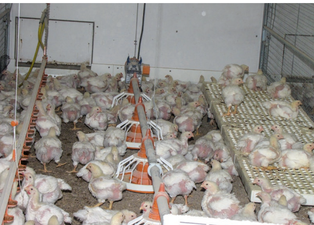
Abb. 1 | Übersicht über die Haltung der Mastpoulets in einem Abteil.