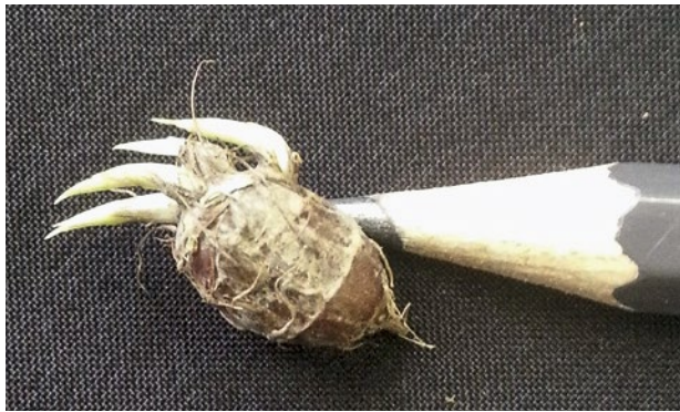
Abb. 2 | Ein Knöllchen kann mehrere Triebe bilden; Durchmesser der Knöllchen von 0.5 – 15 mm.

(Abb. 3). Aus einem Knöllchen treibt mindestens ein Rhizom in Richtung Bodenoberfläche. Knapp unter der Oberfläche entsteht eine Verdickung (Basalzwiebel) am Rhizom, aus welcher Blätter und Stängel nach oben, Wurzeln nach unten und Rhizome zur Seite hin wachsen. Entlang der Rhizome können sich weitere Basalzwiebeln bilden; am Ende der Rhizome bilden sich die Knöllchen (Abb. 4). Die neu gebildeten Knöllchen sind zunächst weiss und weich und ändern ihre Farbe im Lauf der Reifung über hell- zu dunkelbraun. Überjährige Knöllchen sind schwarz und hart. Laut Literaturangaben befinden sich mehr als 80 % der Knöllchen in den oberen 15 cm der Bodenschicht (Stoller und Sweet 1987).