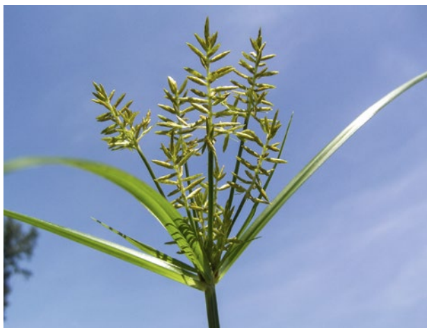
Abb. 5 | Blütenstand des Erdmandelgras. Erscheint diese Blüte auf dem Acker müssen die Alarmglocken läuten.

Die Lebensdauer der Knöllchen im Boden wird in der Literatur mit ca. fünf Jahren angegeben, wobei die Keimfähigkeit mit den Jahren abzunehmen scheint (Kassl 1992).