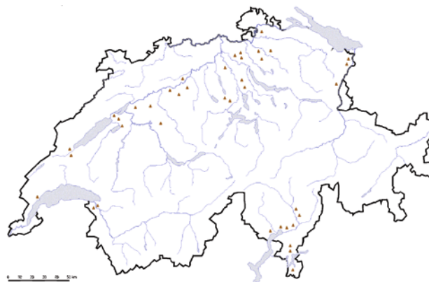
Abb. 6 | Bekannte Standorte von Erdmandelgras ( Cyperus esculentus L.) in der Schweiz, Sommer 2013.

Verschleppung: Die Verschleppung von Knöllchen muss bemerkt und verhindert werden. Einerseits gilt es, die Verschleppung innerhalb des Feldes zu unterbinden. Dies erfordert eine frühzeitige Erkennung des ersten Befalls. Andererseits muss die Verschleppung von Parzelle zu Parzelle verhindert werden. Fahrzeuge und Maschinen sollten nicht von einem verseuchten Feld zu einem sauberen wechseln dürfen, ohne vorher auf dem