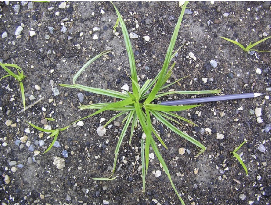
Abb. 3 | In wenigen Wochen nach der Keimung bilden sich viele Triebe um ein Mutterknöllchen.

Bodenschicht bis 20 cm zu finden; vereinzelt werden sie auch in tieferen Schichten (bis 50 cm) aufgefunden. Die Knöllchen haften an Wurzelfrüchten wie Kartoffeln, Zuckerrüben, Rando, Karotten und vielen anderen Erntegütern, sowie an Maschinenteilen und Rädern von Fahrzeugen und Schuhwerk. Dadurch werden sie auf Äckern und Gemüsefeldern mittels Maschinen und Fahrzeugen direkt oder über Ernteabfälle und Erdverschiebungen indirekt verteilt.