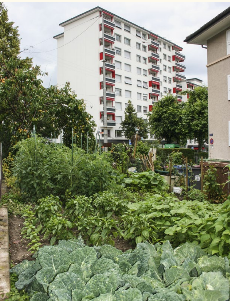
Abb. 1 | Urbane Landwirtschaft: Gemüseproduktion vor der Haustür in Lausanne.

Auskünfte: Anna Crole-Rees, E-Mail: anna.crole-rees@agroscope.admin.ch