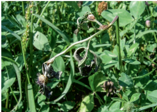
Abb. 2 | Südlicher Stängelbrenner ( Colletotrichum trifolii ) auf Rotklee. Diese bedeutende Krankheit kann grossen Einfluss auf die Ausdauer der entsprechenden Sorten haben.

echten ( Erysiphe poligoni ) und falschen Mehltaus ( Peronospora trifolii ), der Ringfleckenkrankheit ( Stemphylium sarcinaeforme ) und gelegentlich auch der Kleeschwärze ( Camadothea trifolii ; Michel et al. 2000). Einige Sorten des Rotkleees können hohe Gehalte des Pflanzenöstrogens Formononetin aufweisen (Schubiger und Lehmann 1994b). Da bei anhaltender Fütterung mit rotkleereicher Ration Fruchtbarkeitsstörungen bei den Tieren nicht ausgeschlossen werden können, sind Sorten mit wenig Formononetin von besonderem Wert.