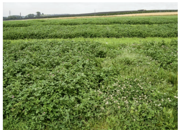
Abb. 3 | Sortenversuch mit Rotklee: Erster Aufwuchs im zweiten Hauptnutzungsjahr. Die unterschiedliche Bestandesqualität ist augenfällig.

Damit eine Sorte in die «Liste der empfohlenen Sorten von Futterpflanzen» (Suter et al. 2012a) aufgenommen werden kann, muss ihr Index um mindestens 0,20 Punkte geringer sein als das Mittel der Indizes der bereits empfohlenen Sorten (Standard). Eine bereits empfohlene Sorte kann ihre Empfehlung verlieren, wenn ihr Index den Standard um mehr als 0,20 Punkte überschreitet (höherer Wert = schlechtere Eigenschaften).