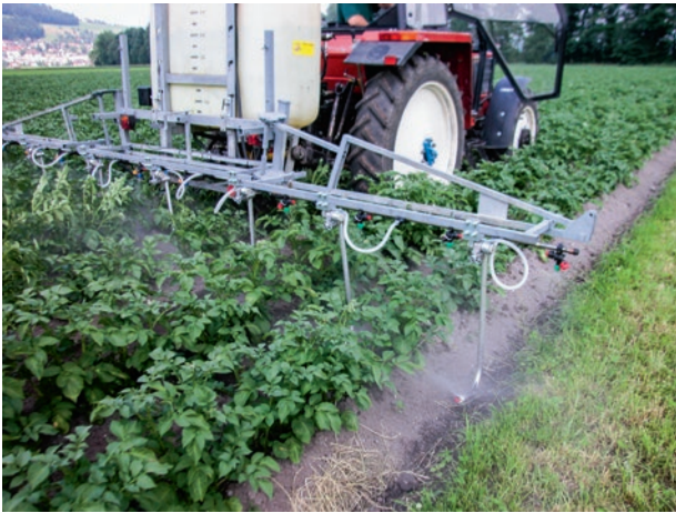
Abb. 2 | Mit der Unterblattapplikation lassen sich Pflanzenschutzmittel besser auf die Blattunterseite ausbringen. Im Kartoffelbau eignet sich diese Technik jedoch nur bis zum Reihenschluss. Später würden sich die «Droplegs» in den Pflanzen verfangen und Schäden anrichten.

Kupfereinsatzes sollten nach dem tatsächlichen Einsatz beurteilt werden. Dieser kann in einzelnen Kulturen 10–30-mal tiefer sein als die erlaubte Höchstmenge.