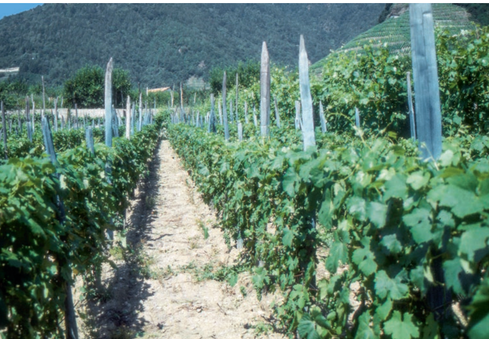
Abb. 1 | Der blaue Belag auf diesen Rebpfählen zeugt von jahrzehntelanger Anwendung hoher Kupfermengen (Bild aus dem Jahr 1989).

Auskünfte: Bernhard Speiser, E-Mail: bernhard.speiser@fibl.org