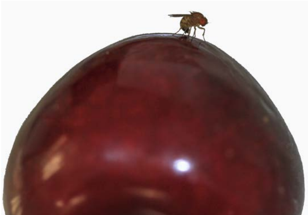
Abb. 1 | Die ökologische Intensivierung muss sich auf nachhaltige Pflanzenschutzmethoden abstützen können mit einem rationalen Einsatz von Pflanzenschutzmitteln, wenn keine anderen wirksamen und machbaren Massnahmen zur Verfügung stehen. Bild: Kirschessigfliege ( Drosophila suzukii ).

Entwicklung von Pathogenen und Vorhersage von Infektionsrisiken ermöglichen einen gezielten Einsatz von Pflanzenschutzmitteln. Die Diagnostik zum Nachweis von Pathogenen und die Unterstützung der Produktion von Basismaterial für die Zertifizierung sind die Grundlage für eine nachhaltige Landwirtschaft.