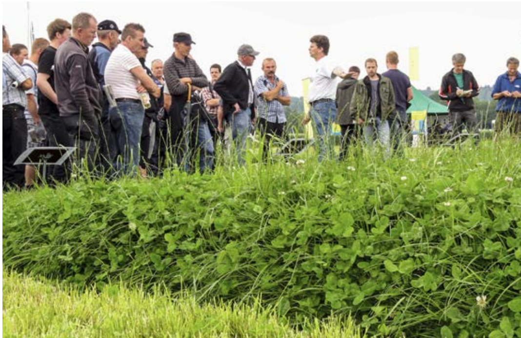
Versuchsbesichtigung: Die Weiterentwicklung von Klee-Gras-Mischungen für einen leistungsfähigen Futterbau und eine gesunde Fruchtfolge setzt einen engen Kontakt mit der Praxis voraus.