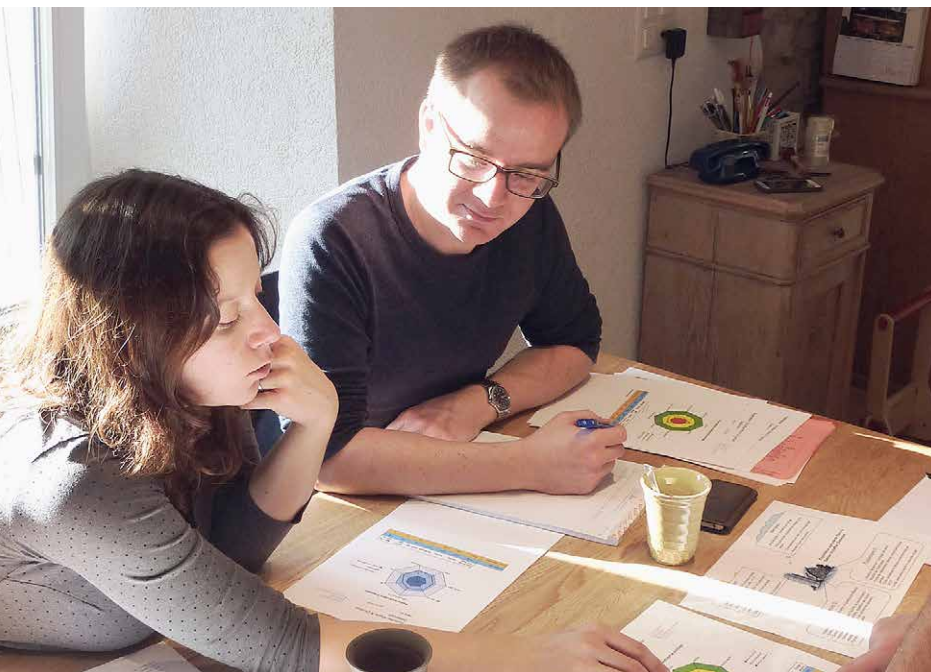
Gesamtheitliche Beratung in einem interdisziplinären Team.