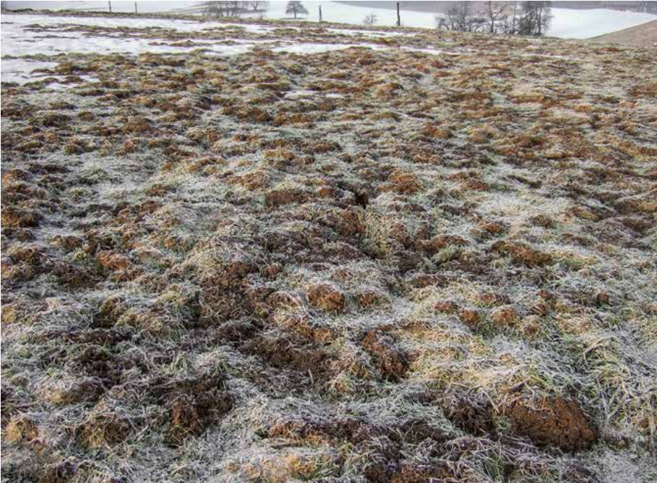
Abb. 4 | Ein sehr hoher Mäusebefall führt zu grossen Schäden in einer Wiese. Das Bild zeigt eine Dichte der Kategorie «Totalschaden».

den Plans eingezeichnet und gezählt, solange sie bei geringer Dichte noch unterscheidbar sind (Abb. 3). Die Auszählbreite sollte pro Person 10m nicht überschreiten. Sind die zu erhebenden Streifen breiter, braucht es entsprechend weitere parallele Durchgänge. Es wird eine Fläche von mindestens 30 Aren empfohlen. Die Aufnahme muss bei kurzer Vegetation – zum Beispiel zu Vegetationsbeginn – erfolgen, damit keine Mäusespuren übersehen werden.