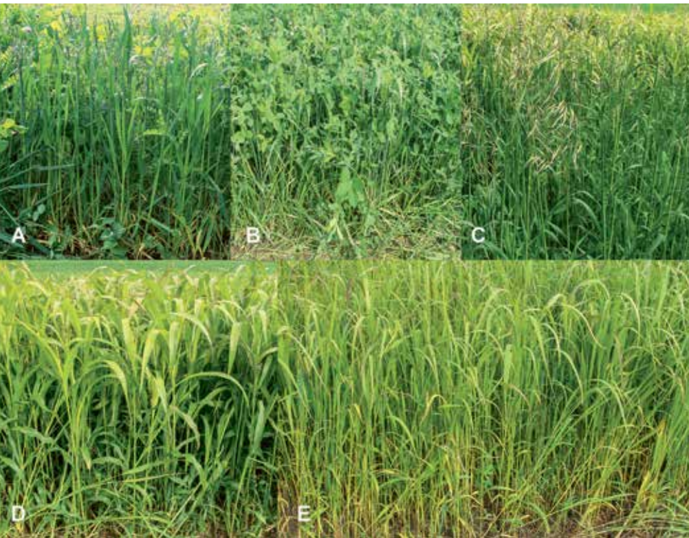
Die zwei Standardmischungen 101 (A) und 106 (B) sowie die Mischungen mit Sand-Hafer (C), Sorghum (D) und Moha (E) wurden untersucht.

Auskünfte: Ueli Wyss, E-Mail: ueli.wyss@agroscope.admin.ch