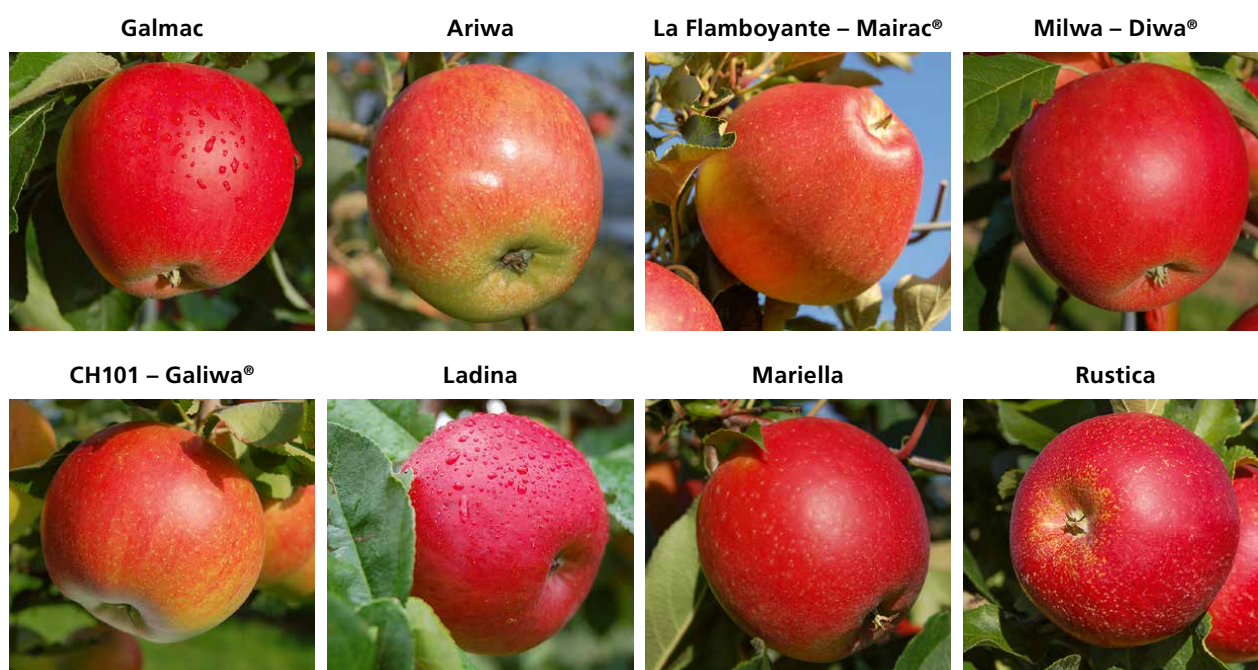
Abb. 2 | Aktuelle von Agroscope entwickelte Apfelsorten.