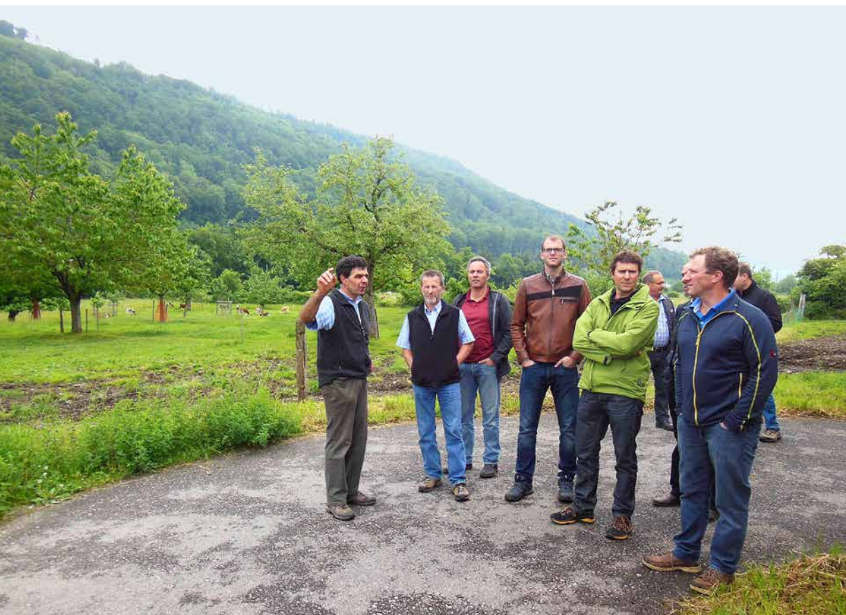
Austausch in einem Arbeitskreis.