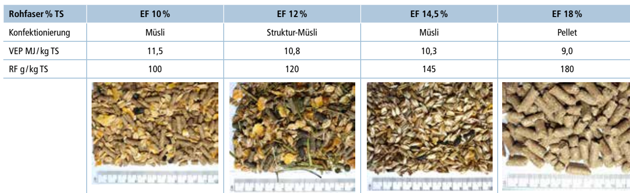
Tab. 1 | Zusammensetzung der getesteten Ergänzungsfuttermittel.

EF: Ergänzungsfuttermittel VEP: Verdauliche Energie Pferd RF: Rohfaser TS: Trockensubstanz