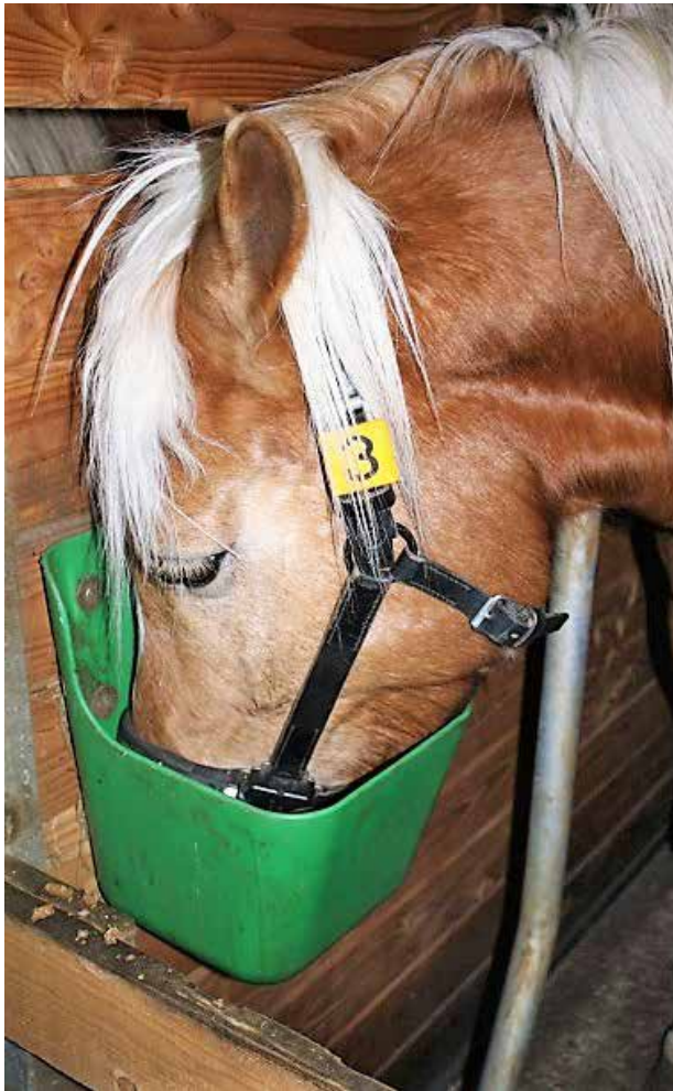
Versuchspferd mit dem Equiwatch®-Halfter zur Messung von Futteraufnahmezeit und Kaufrequenz.