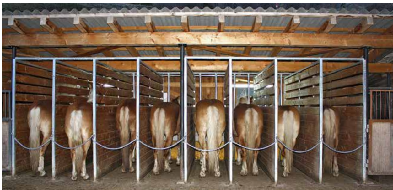
Abb. 1 | Versuchspferde in den Fressständen an den Messtagen.

Für die unterschiedlichen EF betrugen die Futteraufnahmezeiten 11,6 bis 15,8 min pro kg (Tab. 2; Abb. 2), hierbei nahmen die Pferde im Mittel 68 \pm 15 g pro min von den verschiedenen Futtermitteln auf. Die längsten Futteraufnahmezeiten mit den geringsten Aufnahmemengen pro min wurden für die EF mit den RF-Gehalten von 14,5 % und 18 % festgestellt ( p < 0,05 ). Deutlich schneller wurden die beiden EF mit einem RF-Gehalt von 10 und 12 % gefressen ( p < 0,05 , Tab. 2). Die Kauschläge variierten in der Summe zwischen 1136 und 1472 Schläge pro kg EF, wobei mittlere Kaufrequenzen zwischen 99 und 112 Schläge pro min festgestellt wurden (Tab. 2). Die höchste