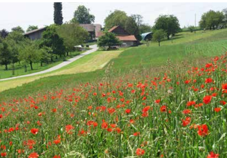
Abb. 1 | Bei einer Umstellung auf Biolandbau würden mindestens 50% der heute verwendeten Menge an Pflanzenschutzmitteln eingespart.

Auskünfte: Lucius Tamm, E-Mail: lucius.tamm@fibl.org