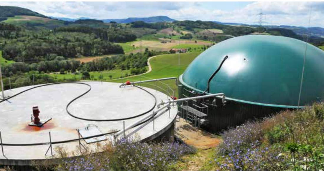
Das Gärgut aus Biogasanlagen eignet sich als rasch wirksame N-Quelle für Ackerkulturen oder Grünland: landwirtschaftliche Vergärungsanlage in Kaisten (AG).

Auskünfte: Jochen Mayer, E-Mail: jochen.mayer@agroscope.admin.ch