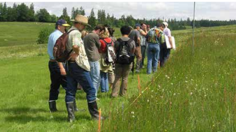
Der Vergleich von verschiedenen Phosphor- und Kalium-Düngungsverfahren auf einer Weide im Jura stösst bei zahlreichen Besuchern auf Interesse.