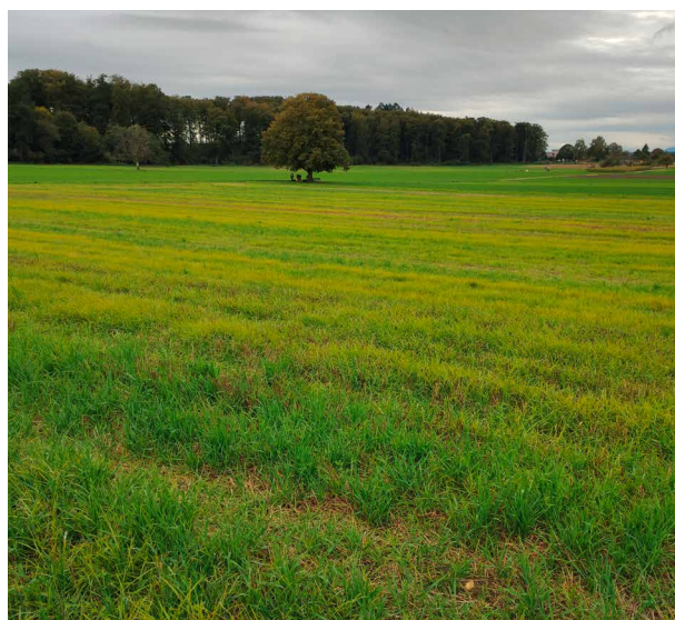
Abb. 4 | Dicht aufgelaufenes EMG auf einer Getreidestoppel (Parzelle n° 1a). Nach der Weizenernte wurde keine Bodenbearbeitung gemacht und keine Zwischenfrucht gesät.

Auf sechs Betrieben blieb der EMG-Befall über den Untersuchungszeitraum trotz angewandter Massnahmen konstant, d.h. die Bekämpfung war nicht erfolgreich (Abb. 2B). Der EMG-Befall konnte lediglich stabil gehalten werden. Der Mais wurde durchgehend vor dem 20. Mai gesät was, bis auf eine Ausnahme (n° 3), nicht zu einer Veränderung der Knöllchenzahlen führte. Eine frühe Maissaat ist bei der EMG Bekämpfung nicht zu empfehlen. Der Anbau von Getreide, Sommerzwiebeln und Zucchetti, sowie eine zweijährige Kunstwiese führten ebenfalls zu keiner Veränderung des EMG-Befalls.