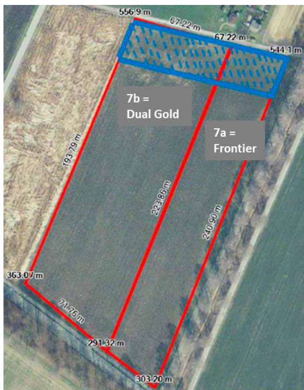
Abb. 3 | Aufnahme der Parzelle 7. 7a = mit Frontier X2 behandelte Hälfte, 7b = mit Dual Gold behandelte Hälfte, blau schraffierte Fläche = verseuchter Teil des Feldes in dem die Probenahmen erfolgten.

de Bolero (Imazamox) angewandt. Nach der Weizenernte 2019 wurde eine Stoppelbehandlung mit Glyphosat durchgeführt.