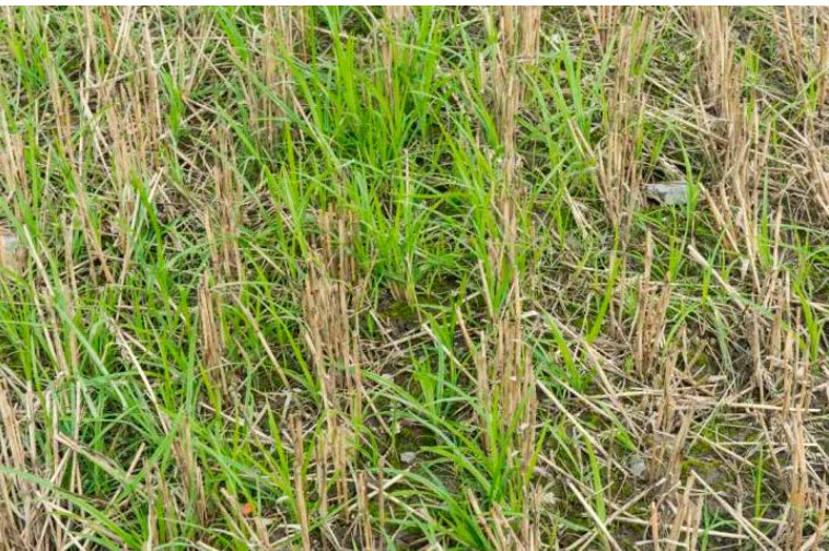
Erdmandelgras in Getreidestoppeln.

https://doi.org/10.34776/afs12-196 Publikationsdatum: 7. Dezember 2021