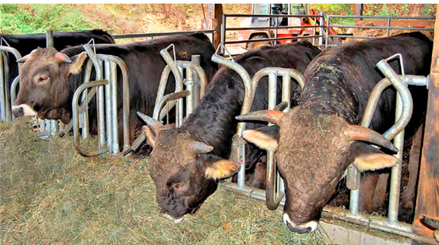
Masttiere auf dem Hofgut Rengoldshausen, Überlingen, DE.

https://doi.org/10.34776/afs14-90 Publikationsdatum: 7. Juni 2023