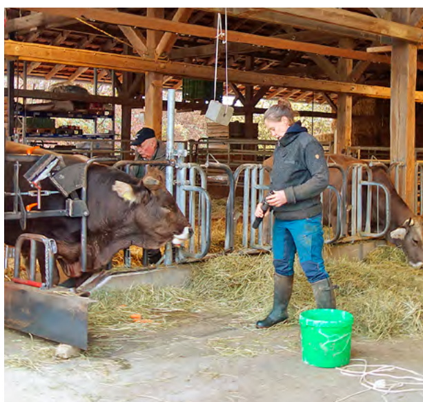
Abb. 1 | Vorbereitung der Betäubung eines Tieres auf dem Hofgut Rengoldshausen. Das Tier ist im Spezial-Selbstfangfressgitter fixiert.

Für die Schlachtung im Schlachthof vorgesehene Nutztiere sind verschiedenen stressauslösenden Situationen ausgesetzt, zum Beispiel der Trennung von der Herde, dem Transport, dem Zusammentreffen mit unbekanntem Tieren und Menschen, oft langen Wartezeiten in ungewohnter und enger Umgebung sowie ungewohnten Geräuschen und Gerüchen (Grandin & Shivley, 2015; Terlouw, 2015). Der Cortisolgehalt im Blutserum ist ein gängiges Merkmal zur Messung von physiologischem Stress (Probst, 2013; Losada-Espinosa et al. , 2018). Hemsworth et al. (2011) zeigten, dass ein hoher Cortisolgehalt im Stichblut von Rindern mit einer hohen Anzahl von Treibvorgängen mit elektrischen Treibhilfen oder Gummistöcken, aber auch mit dem Schlachthof und mit der geschlachteten Gruppe zusammenhängt. Lactat- und Glucosegehalte im Stichblut werden oft zusätzlich gemessen, um Stress festzustellen (Broom, 2003; Apple et al. , 2005; Averós et al. , 2008; Petherick et al. , 2009). Die beiden Stoffe werden infolge der Ausschüttung des Cortisols freigesetzt und geben dem Tier Energie, zum Beispiel für eine Flucht. Auch Vokalisationen und Abwehrbewegungen können Stress anzeigen (Bourguet et al. , 2011). Stress vor der Schlachtung kann zu verminderter Fleischqualität führen (Warner et al. , 2007; Gruber et al. , 2010; Probst et al. , 2012; Reiche et al. , 2019). Hoftötungen und Weidetötungen zielen darauf ab, den Stress der Tiere vor der Schlachtung zu minimieren. Seit Juli 2020 sind gemäss der Verordnung 817.190 über