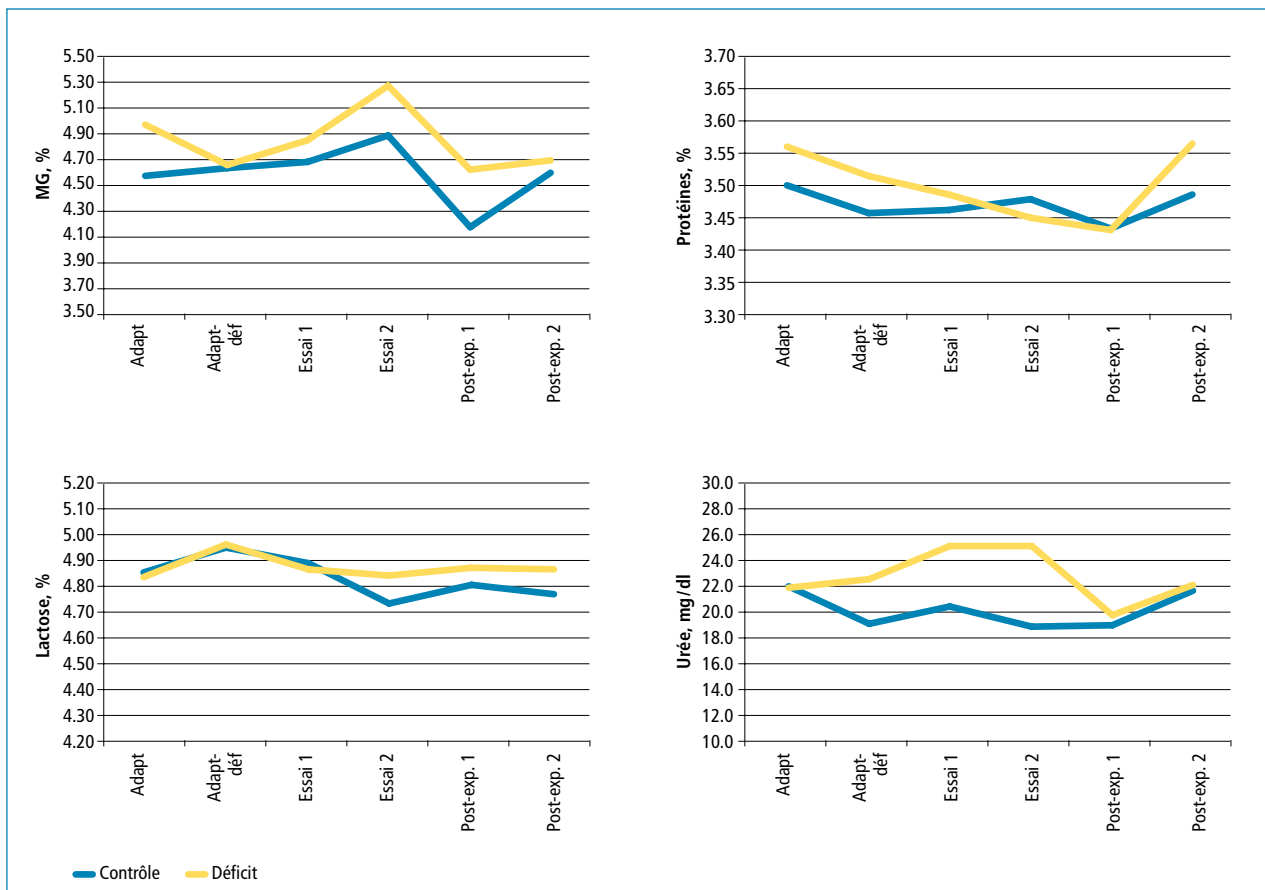
Figure 2 | Evolution des teneurs en matière grasse, protéines, lactose et urée durant les différentes phases de l'essai.

Dans le groupe C comme dans le groupe D, la production laitière a chuté d'environ 2 à 2,5 kg entre la période d'adaptation et la deuxième semaine d'essai. Malgré le déficit énergétique auquel elles ont été soumises, les vaches du groupe D n'ont pas réagi de façon plus marquée que celles du groupe de contrôle pendant les deux semaines d'essai. Elles ont donc probablement davantage puisé dans leurs réserves corporelles. Au retour en stabulation libre, la production laitière des deux groupes a de nouveau augmenté. La diminution de la production laitière semble par conséquent davantage liée au changement du système de garde qu'au déficit énergétique. Les teneurs du lait des vaches du groupe D ont évolué