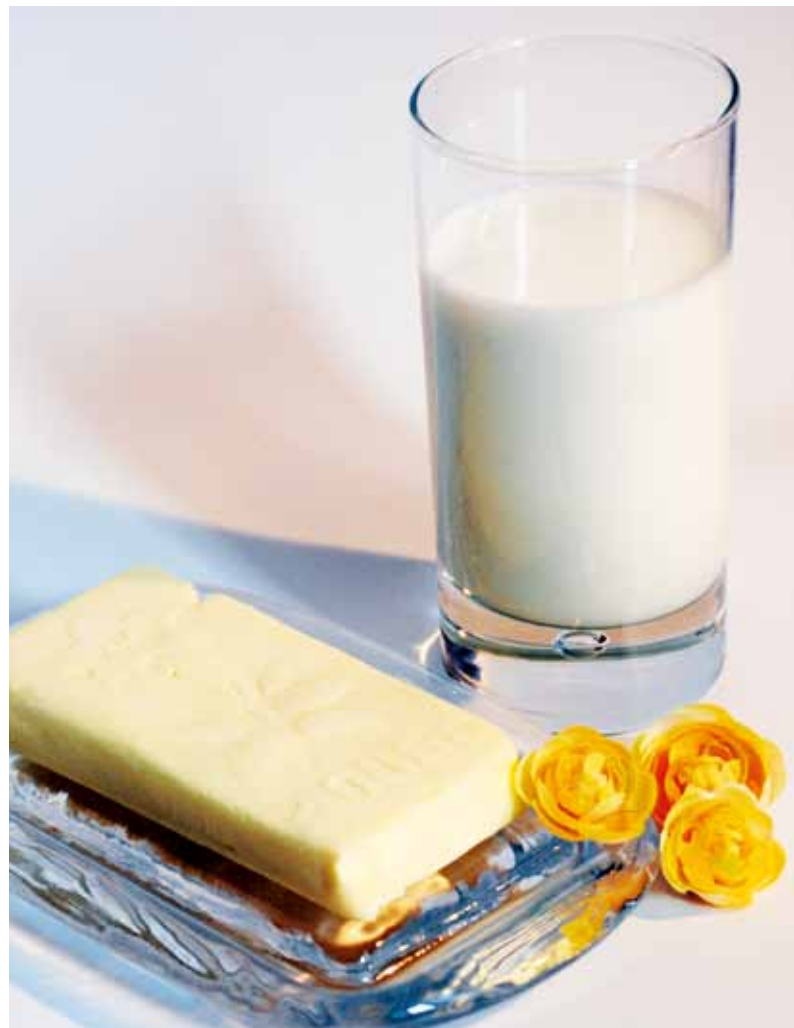
Figure 4 | Durant la phase de déficit énergétique, la teneur en matière grasse et en oméga-3 dans le lait était plus élevée que lorsque les vaches étaient nourries conformément aux recommandations.

groupe D entre l'adaptation et le déficit avant de se stabiliser en phase post-expérimentale et, parallèlement, la part des AG monoinsaturés augmente de 0,8 point pourcent et se stabilise également par la suite. Les AG polyinsaturés réagissent de même positivement au moment du déficit (+0,2 point pourcent) avant de retomber ensuite au taux initial. Le groupe de contrôle subit aussi certains changements dans ces relations entre groupes d'AG mais de façon beaucoup plus linéaire comme une évolution dans le temps. >