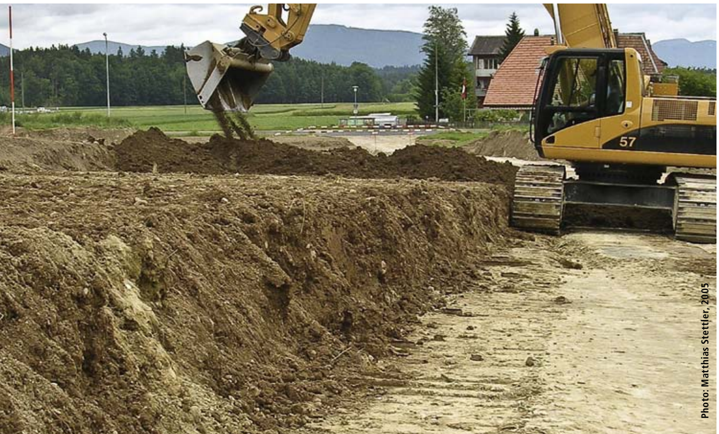
Reconstitution du sol: déversement de la terre superficielle sur le sous-sol préalablement préparé.