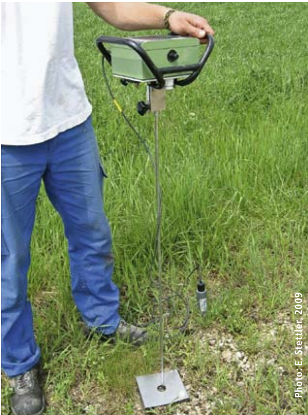
Figure 3 | Penetrologger de la firme Eijkelkamp Agrisearch Equipment, Giesbeek (NL), avec une sonde d'humidité reliée par câble. La plaque à la surface du sol sert de référence pour la profondeur des mesures.

inférieure à la capacité au champ, mais il était impossible de repousser davantage à cause du développement des cultures. Les mesures de Wanzwil et Hersiwil ne peuvent donc pas être directement comparées.