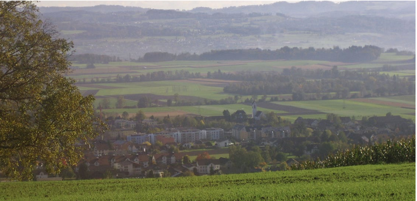
Haies et vergers marquent le paysage de Boswil (AG).