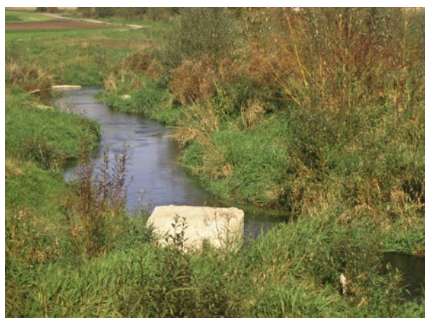
Figure 2 | ...et après: renaturé.

deux concepts de développement, un pour le paysage et un pour l'agriculture, et a été réalisée rapidement (encadré «Réalisation de l'amélioration»).