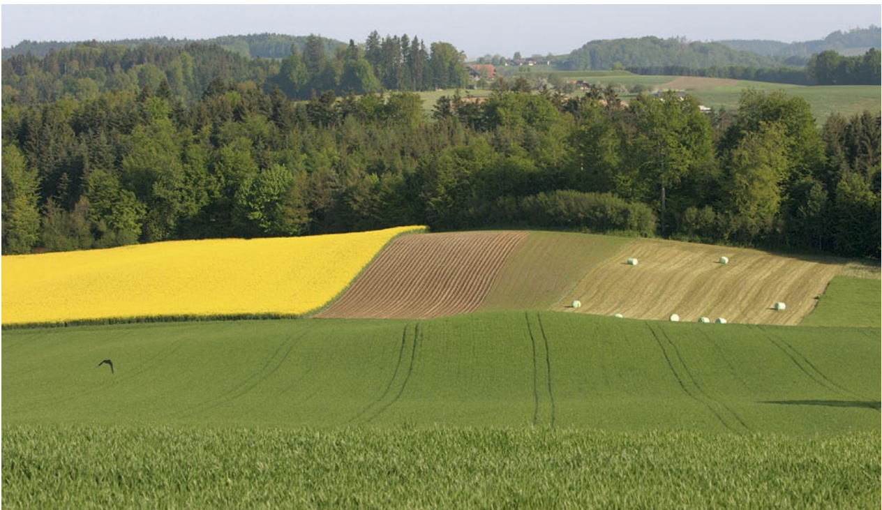
Le changement climatique déplacera les régions propices à la production agricole.

Dans ce contexte, la direction de l'OFAG a établi en mai 2009 le mandat pour élaborer une stratégie climatique pour l'agriculture suisse. Il s'agissait de thématiser la contribution de l'agriculture au changement climatique, les possibilités et les limites en matière de réduction des émissions de gaz à effet de serre ainsi que l'influence du changement climatique insidieux sur l'agriculture et, enfin, l'adaptation de cette dernière à ce changement. La stratégie climatique met l'accent sur l'agriculture, à l'instar du document stratégique «Agriculture et filière alimentaire 2025» (OFAG 2010), mais les secteurs situés