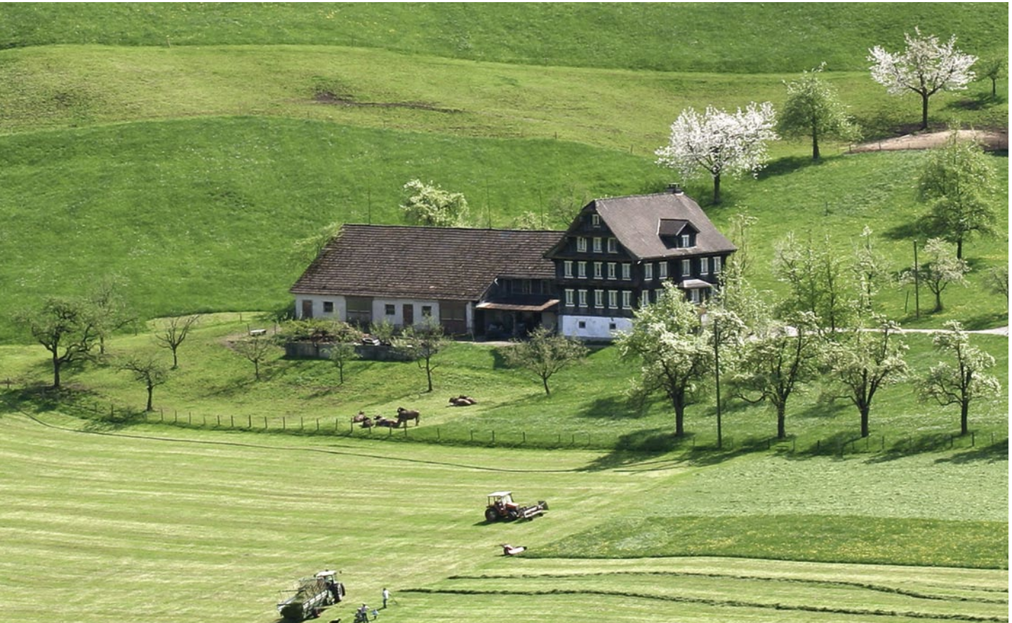
L'agriculture est à la fois victime et acteur du changement climatique.