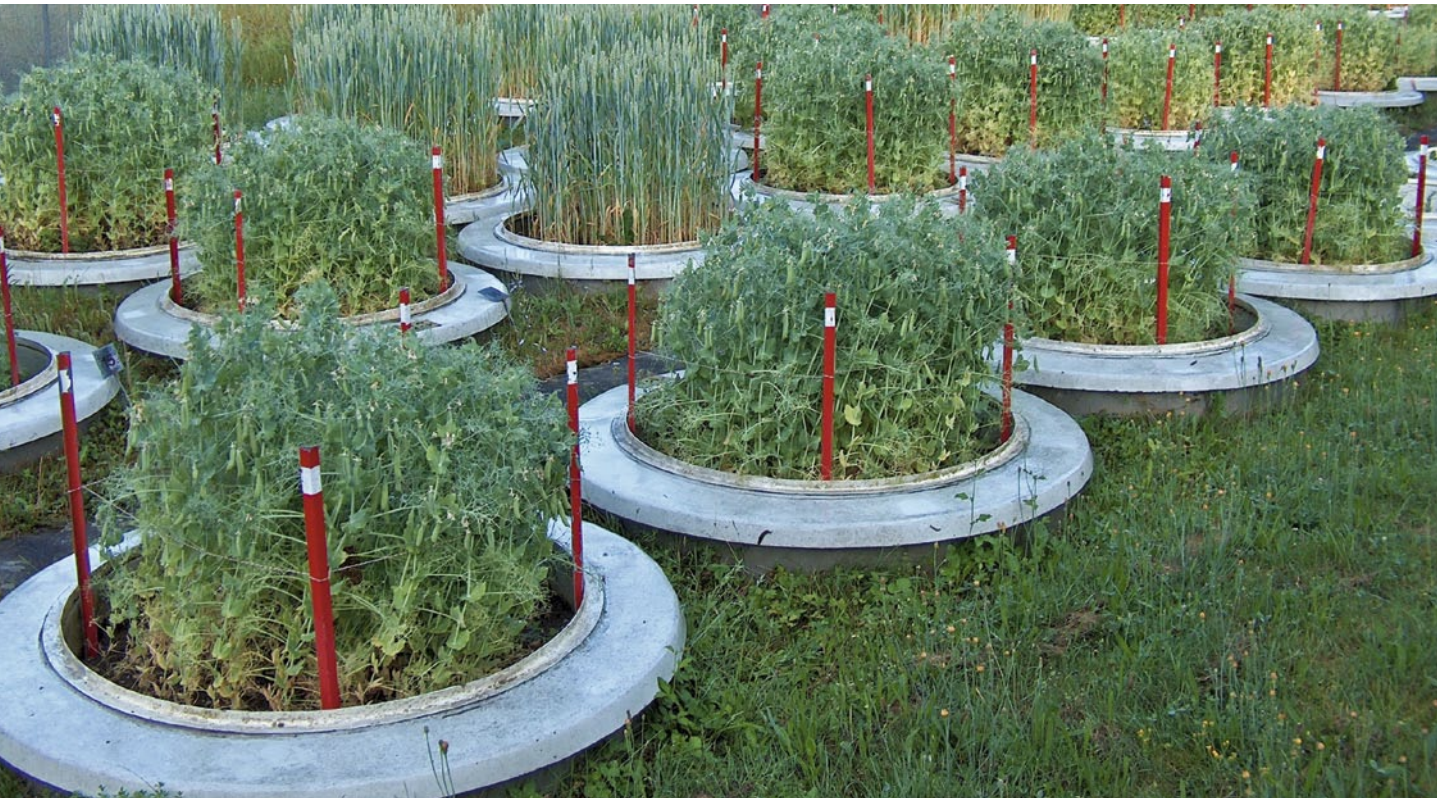
Lysimètres à Berne-Liebfeld avec pois protéagineux et blé d'automne.