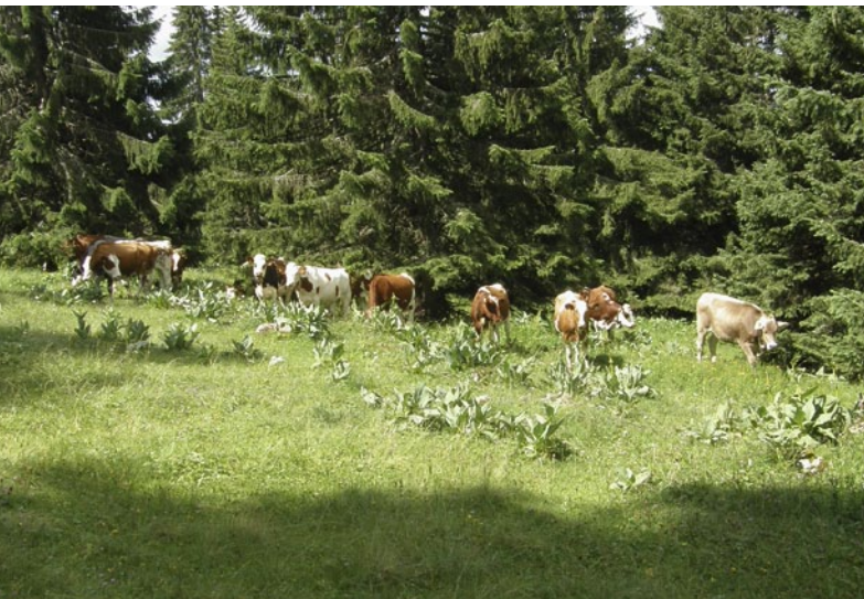
Pâturage dans la région modèle du Jura.

Renseignements: Robert Huber, e-mail: robert.huber@wsl.ch, tél. +41 44 739 23 38