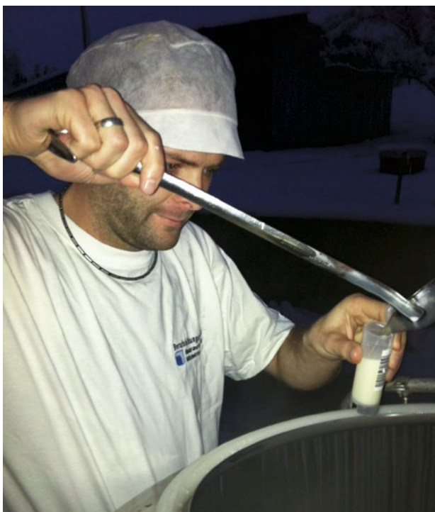
Figure 2 | Prélèvement manuel des échantillons pour le contrôle du lait.

des résultats manquants provient d'échantillons prélevés manuellement. Parmi ceux-ci, une partie est due au fait que la date de livraison du lait ne correspond pas à la date de l'ordre de prélèvement et donc à la collecte des échantillons.