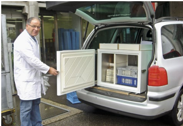
Figure 3 | Maintien de la chaîne du froid pendant le transport des échantillons.

B Suissselab organise des tournées séparées de collecte d'échantillons et facture les coûts supplémentaires aux acheteurs de lait par le biais d'un tarif kilométrique et d'un tarif horaire.