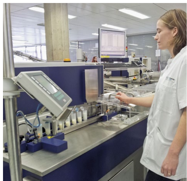
Figure 4 | Détermination du nombre de germes totaux avec le BactoScan.

Le prélèvement a été organisé sur la base d'un échantillonnage aléatoire de n = \text{env. } 500 afin que des échantillons avec des nombres de germes «proches des valeurs limites» et élevés soient inclus dans l'échantillonnage. Les échantillons ont été prélevés sur des livraisons de lait effectuées tous les 2 jours, composées donc de quatre traites. La dernière traite était toujours celle du matin. Pour des raisons de capacité, l'essai a été effectué sur six jours, en juillet et août 2011. Les échantillons ont été acheminés chez Emmi à Ostermundigen et à Suhr de même que chez Hochdorf Nutritec à Sulgen. Le mandat de prélèvement des échantillons a été confié directement aux entreprises de transport participant à l'essai (TGL AG, Rolli Transporte AG, Meyer Transport AG et AS milch-logistik GmbH). Après réception des échantillons par le laboratoire d'analyses, ceux-ci ont été divisés en deux moitiés. Chaque moitié d'échantillon a été munie d'un code-barres afin de garantir la traçabilité jusqu'à l'échantillon initial et au producteur de lait. Les échantillons ont été conservés à une température de 1 à 5 °C jusqu'à leur analyse. Ils ont été analysés le jour suivant à 12 h 00 (1 re moitié de l'échantillon) et à 18 h 00 (2 e moitié de l'échantillon; fig. 4). Cela correspond à une durée de conservation des échantillons de 30 et de 36 heures à partir de la dernière traite. Les traites les plus anciennes remontaient donc à respectivement 66 et 72 heures.