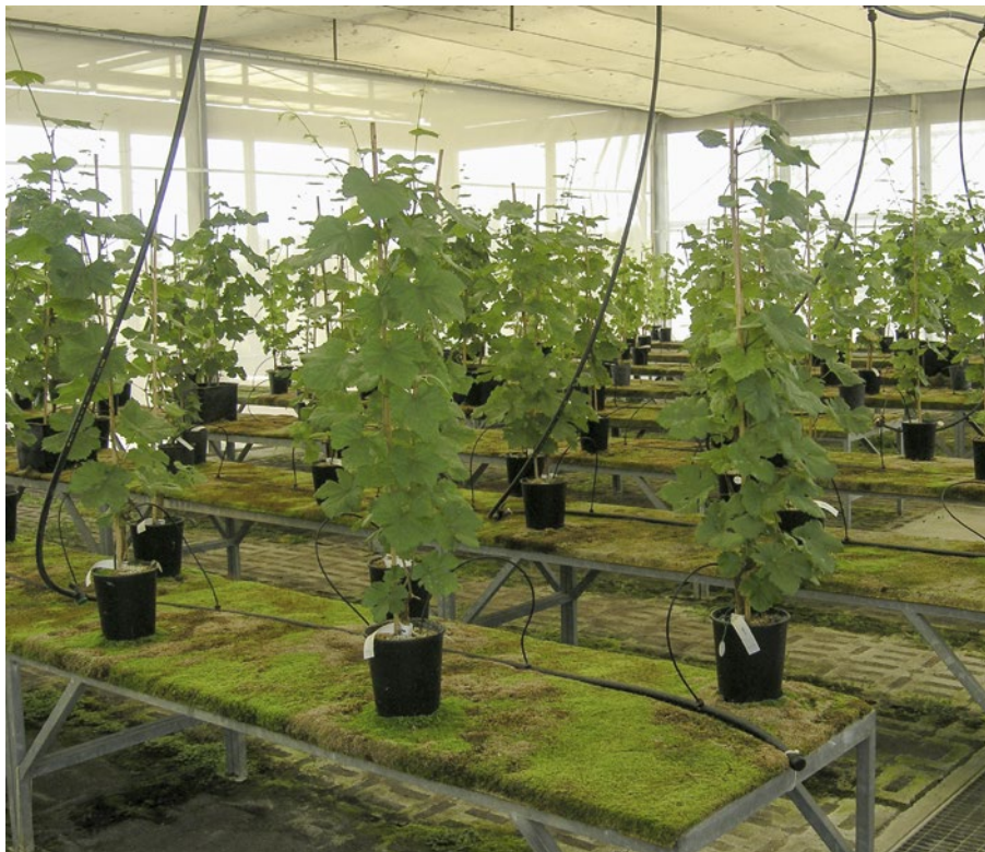
Figure 3 | Conservatoire en serre à l'abri des insectes du matériel de base des cépages homologués en Suisse.

pean Genebank Integrated System) qui fait partie d'un programme européen pour la conservation des ressources génétiques des plantes cultivées, un certain nombre d'anciennes variétés cultivées en Suisse vont être caractérisées par microsatellites, et leurs profils comparés à ceux établis pour une sélection d'anciennes variétés européennes.