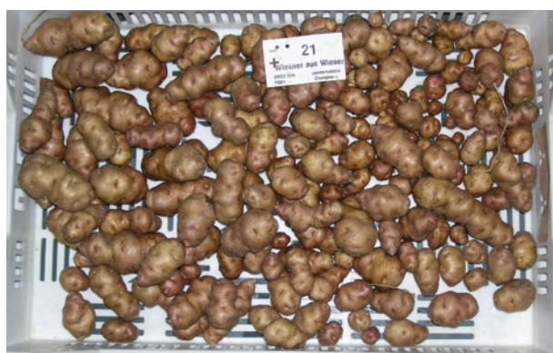
Figure 2 | Exemple de confusion entre variétés de pomme de terre. En haut la variété Parli, en bas la variété Wiesner aus Wiesen. Leurs profils génétiques et leurs descriptions morphologiques sont identiques, comme ici dans le cas de leurs tubercules. Il s'agit donc d'une seule variété connue sous deux appellations locales différentes.