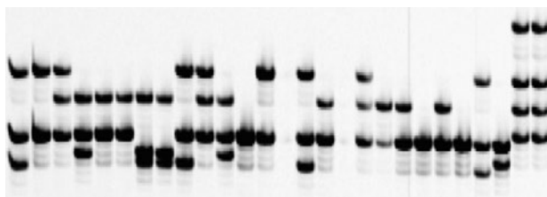
Figure 1 | Exemple de génotypage au moyen d'un microsatellite pour 25 variétés de pommes de terre.