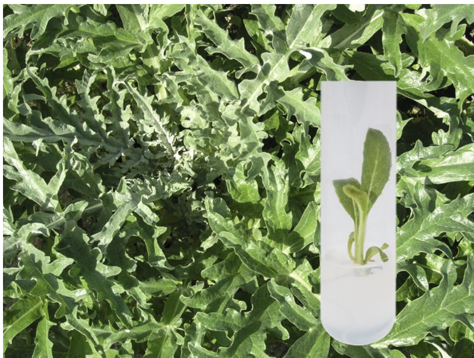
Figure 4 | Artichaut Petit Violet de Plainpalais en pleine terre et conservé in vitro .

ont été mis en route par Médiplant et l'Université de York au Royaume-Uni (Graham et al. 2010). Le conservatoire in vitro d'ACW a été chargé de maintenir les accessions issues de ces croisements et d'assurer leur identité par une caractérisation génétique. Une septantaine d'accessions sont en cours d'évaluation au moyen de 9 microsatellites. Une fois les profils obtenus, ils seront comparés avec ceux de la base de données de York.