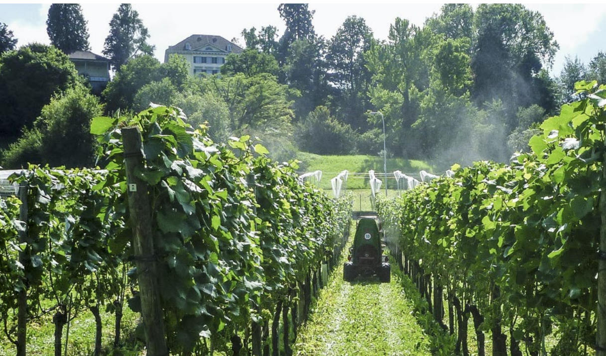
Figure 1 | Dérive visible lors d'une application de produits phytosanitaires sur une vigne.

Simon Schweizer, Heinrich Höhn, Daniel Ruf, Pierre-Henri Dubuis et Andreas Naef Agroscope, Institut des sciences en production végétale IPV, 8820 Wädenswil Renseignements: Simon Schweizer, e-mail: simon.schweizer@agroscope.admin.ch