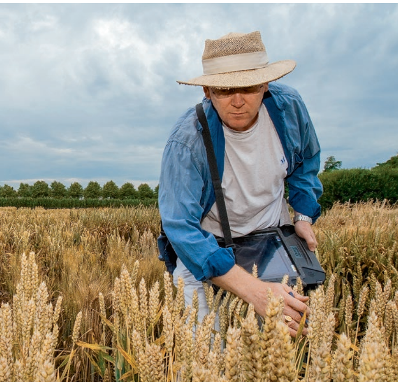
Figure 1 | Les sélectionneurs d'Agroscope sont attentifs aux résistances contre les maladies.

Renseignements: Peter Stamp, e-mail: peter.stamp@usys.ethz.ch