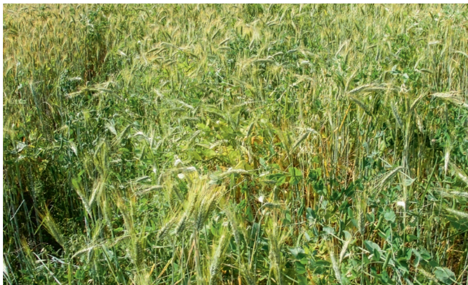
Figure 3 | Le mélange triticales-avoine-pois à la deuxième date de prélèvement en 2013.