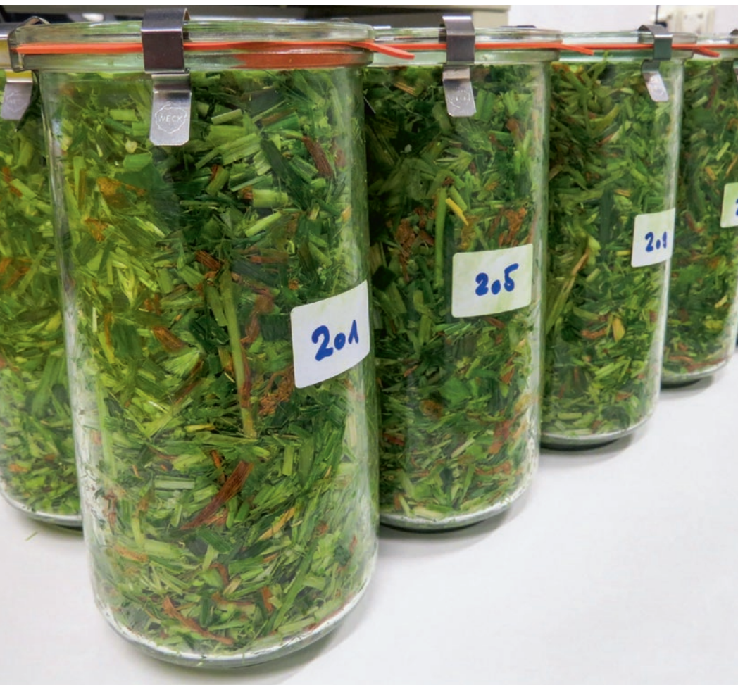
Le fourrage haché a été ensilé dans des silos de laboratoire.

Renseignements: Ueli Wyss, e-mail: ueli.wyss@agroscope.admin.ch