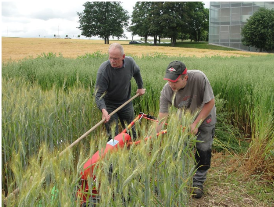
Figure 1 | A la première date de prélèvement, les plantes ont été fauchées avec une motofaucheuse.

ments de même que la teneur en nitrate et le pouvoir tampon. Les coefficients de fermentation ont été calculés sur la base de la teneur en MS, de la teneur en sucres (hydrates de carbone hydrosolubles) et du pouvoir tampon (Weissbach et Honig 1996). Après une durée de